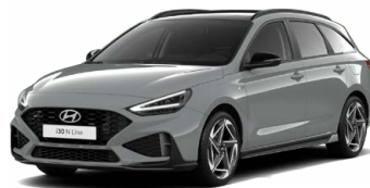
Shadow Gray Pastelová Cena: 16 900 Kč Dostupná pouze pro výbavu N Line Premium