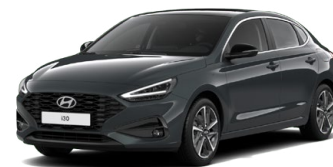
Cypress Green Pearl Perleťová Cena: 16 900 Kč