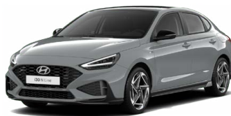
Shadow Gray Pastelová Cena: 16 900 Kč Dostupná pouze pro výbavy N Line