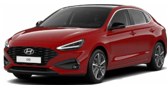
Engine Red Pastelová Cena: 0 Kč