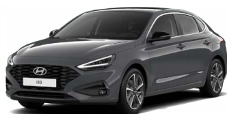
Ecotronic Gray Pearl Perleťová Cena: 16 900 Kč