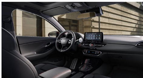
Černý interiér N line Premium – prémiové čalounění v kombinaci kůže/semiš – černé čalounění stropu a obložení bočních sloupků – červeně prošívání sportovní volant, hlavice řadící páky a loketní opěrka