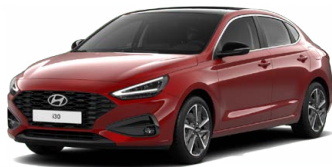
Ultimate Red Metallic Metalická Cena: 16 900 Kč