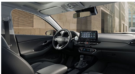
Černý interiér Oceanidis Black Premium – kožené čalounění sedadel – černé čalounění stropu a obložení bočních sloupků – světlé čalounění stropu a obložení bočních sloupků – černé provedení přístrojové desky a výplní dveří