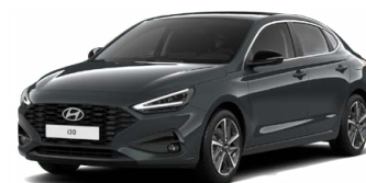
Cypress Green Pearl Perleťová Cena: 16 900 Kč