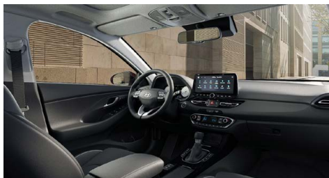
Černý interiér Oceanidis Black – látkové čalounění sedadel – světlé čalounění stropu a obložení bočních sloupků – černé provedení přístrojové desky a výplní dveří