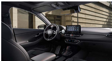
Černý interiér N line Premium – prémiové čalounění v kombinaci kůže/seměš – červeně prošívavý sportovní volant, hlavice řadící páky a loketní opěrka