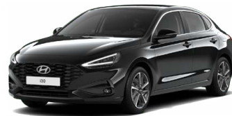
Abyss Black Pearl Perleťová Cena: 16 900 Kč