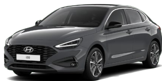
Ecotronic Gray Pearl Perleťová Cena: 16 900 Kč