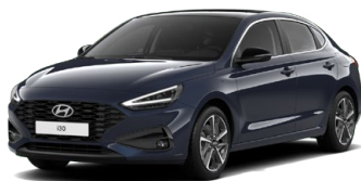
Sailing Blue Pearl Perleťová Cena: 16 900 Kč