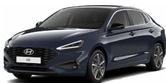
Sailing Blue Pearl Perleťová Cena: 16 900 Kč