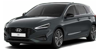
Cypress Green Pearl Perleťová Cena: 16 900 Kč