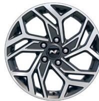
17" kola z lehké slitiny – N Line