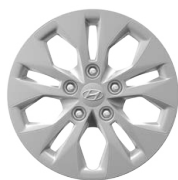
15" ocelová kola s celoplošnými kryty