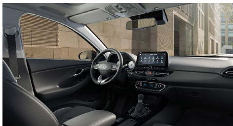
Černý interiér Oceanidis Black – látkové čalounění sedadel – světlé čalounění stropu a obložení bočních sloupků – černé provedení přístrojové desky a výplní dveří