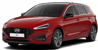
Engine Red Pastelová Cena: 0 Kč