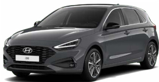
Ecotronic Gray Pearl Perleťová Cena: 16 900 Kč