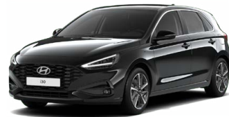
Abyss Black Pearl Perleťová Cena: 16 900 Kč