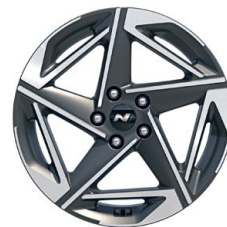
18" kola z lehké slitiny – N Line

* K dispozici pro vozy vyrobené do 9/2024.