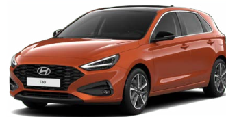
Jupiter Orange Metallic Metalická Cena: 16 900 Kč