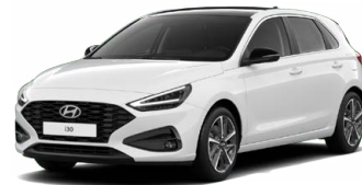
Serenity White Pearl Perleťová Cena: 16 900 Kč