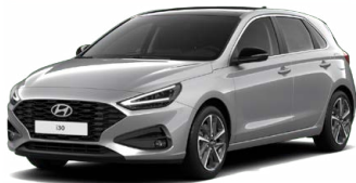
Shimmering Silver Metallic Metalická Cena: 16 900 Kč