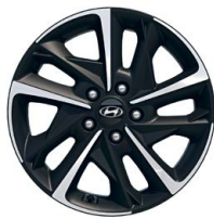
17" kola z lehké slitiny