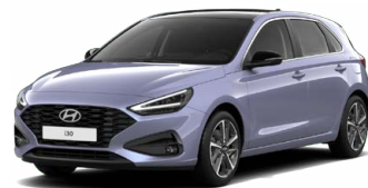
Meta Blue Pearl Perleťová Cena: 16 900 Kč