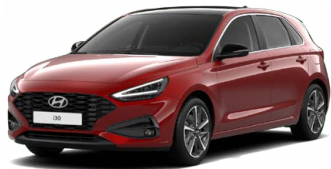
Ultimate Red Metallic Metalická Cena: 16 900 Kč