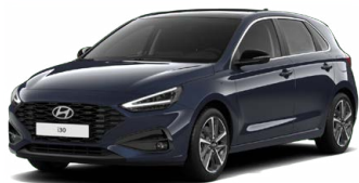
Sailing Blue Pearl Perleťová Cena: 16 900 Kč