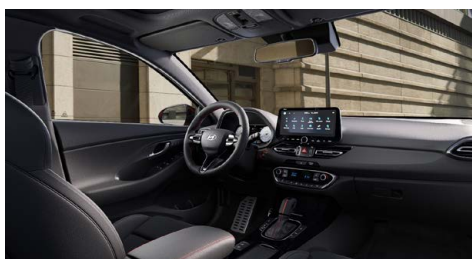
Černý interiér N line Premium – prémiové čalounění v kombinaci kůže/semiš – červeně prošívání sportovní volant, hlavice řadící páky a loketní opěrka