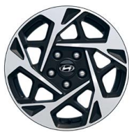
16" kola z lehké slitiny