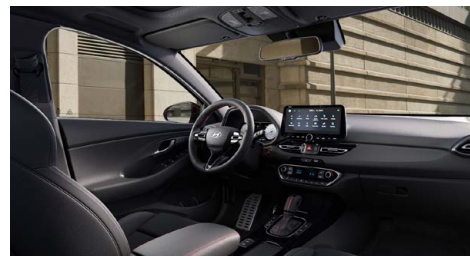
Černý interiér N line – látkové čalounění s červeným prošíváním a logem N – černé čalounění stropu a obložení bočních sloupků – červeně prošívání sportovní volant, hlavice řadící páky a loketní opěrka