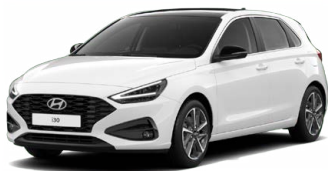
Atlas White Pastelová Cena: 5 900 Kč