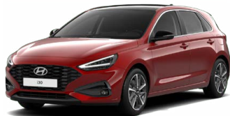
Ultimate Red Metallic Metalická Cena: 16 900 Kč