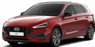
Ultimate Red Metallic Metalická Cena: 16 900 Kč