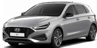
Shimmering Silver Metallic Metalická Cena: 16 900 Kč