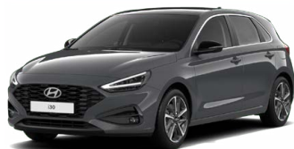
Ecotronic Gray Pearl Perleťová Cena: 16 900 Kč