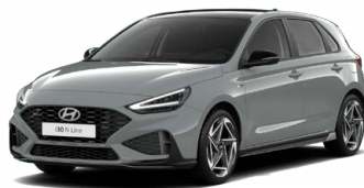
Shadow Gray Pastelová Cena: 16 900 Kč Dostupná pouze pro výbavu N Line Premium