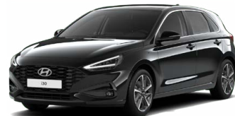
Abyss Black Pearl Perleťová Cena: 16 900 Kč