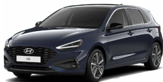
Sailing Blue Pearl Perleťová Cena: 16 900 Kč