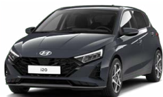
Aurora Gray Pearl Perleťová Cena: 13 900 Kč

Tato exteriérová barva není dostupná s černým interiérem s limetkovými akcenty