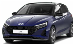
Vibrant Blue Pearl Perleťová Kombinace dostupná také s černým lakováním střechy Cena: 13 900 Kč

Tato exteriérová barva není dostupná s černým interiérem s limetkovými akcenty