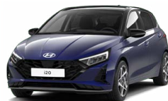
Vibrant Blue Pearl Perleťová Kombinace dostupná také s černým lakováním střechy Cena: 13 900 Kč

Tato exteriérová barva není dostupná s černým interiérem s limetkovými akcenty