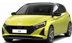
Lucid Lime Metallic Metalická Kombinace dostupná také s černým lakováním střechy Cena: 13 900 Kč

Tato exteriérová barva není dostupná s černým interiérem s limetkovými akcenty