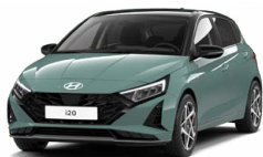
Mangroove Green Pearl Perleťová Kombinace dostupná také s černým lakováním střechy Cena: 0 Kč