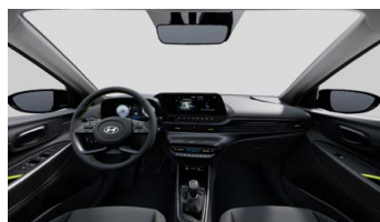
Černý s limetkovými akcenty - černé čalounění sedadel s limetkovým prošíváním - světlé čalounění stropu a obložení bočních sloupků - černé provedení přístrojové desky a středové konzoly - černé provedení výplní dveří s limetkovými akcenty