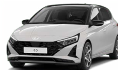
Lumen Gray Pearl Perleťová Kombinace dostupná také s černým lakováním střechy Cena: 13 900 Kč