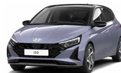
Meta Blue Pearl Metalická Kombinace dostupná také s černým lakováním střechy Cena: 13 900 Kč

Tato exteriérová barva není dostupná s černým interiérem s limetkovými akcenty