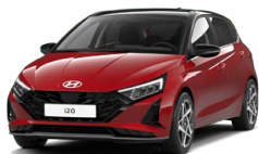
Dragon Red Pearl Perleťová Kombinace dostupná také s černým lakováním střechy Cena: 13 900 Kč

Tato exteriérová barva není dostupná s černým interiérem s limetkovými akcenty