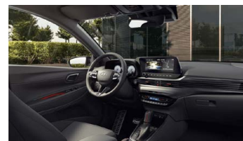
Černý N Line s červenými akcenty - černé čalounění sedadel s červeným prošíváním - černé čalounění stropu a obložení bočních sloupků - černé provedení přístrojové desky a středové konzoly - černé provedení výplní dveří s červenými akcenty