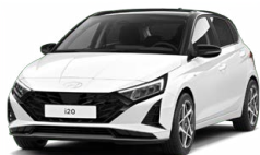
Atlas White Speciální pastelová Kombinace dostupná také s černým lakováním střechy Cena: 5 000 Kč