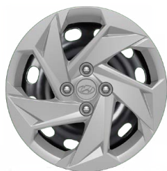
15" ocelová kola s celoplošnými kryty