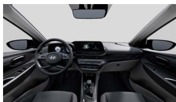
Černo-šedý Shale Gray interiér - černé čalounění sedadel s šedým prošíváním - světlé čalounění stropu a obložení bočních sloupků - světle šedé provedení spodní části přístrojové desky včetně středové konzoly - světlé šedá spodní část výplní dveří