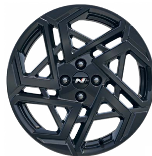
17" kola z lehké slitiny – pouze N Line