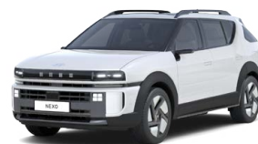
Creamy White Pearl Perleťová Cena: 17 900 Kč