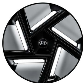
19" kola z lehké slitiny

Všechny ceny se rozumějí v Kč včetně DPH, není-li uvedeno jinak. Dovozce si vyhrazuje právo změny cen a provedení bez předchozího upozornění. Pro konkrétní nabídku se prosím vždy obraťte na nejbližšího prodejce Hyundai. Veškeré ceny, údaje a vyobrazení jsou pouze informativní, doporučené společností Hyundai Motor Czech s.r.o. a nezavazují k uzavření smlouvy. Fotografie jsou pouze ilustrativní.