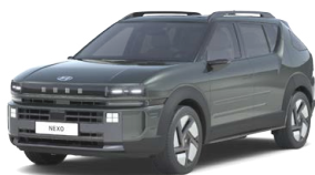
Amazon Gray Metallic Metalická Cena: 17 900 Kč