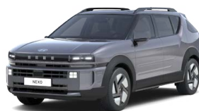
Ecotronic Gray Pearl Perleťová Cena: 17 900 Kč