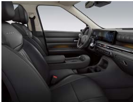
Černý interiér – čalounění sedadel Alcantara/kůže – dostupné pro Luxury