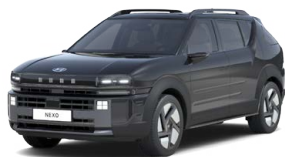
Phantom Black Pearl Perleťová Cena: 17 900 Kč