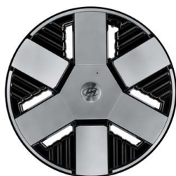
18" kola z lehké slitiny