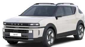
Goyo Copper Pearl Perleťová Cena: 0 Kč