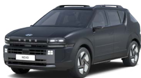
Ocean Indigo Matte Matná metalická Cena: 22 900 Kč