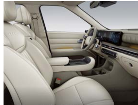
Ivory Gray interiér – čalounění sedadel Alcantara/kůže – dostupné pro Luxury