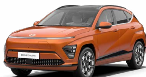
Jupiter Orange Metalická Kombinace s černým lakováním střechy Cena: 17 900 Kč