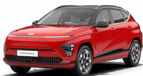
Engine Red Pastelová Kombinace s černým lakováním střechy Cena: 0 Kč