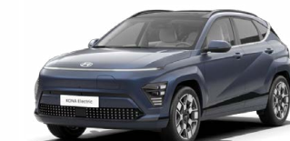
Sailing Blue Perleťová Kombinace s černým lakováním střechy Cena: 17 900 Kč