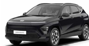
Abbyss Black Pearl Perleťová Cena: 17 900 Kč