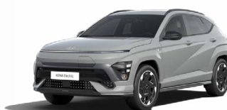
Shadow Grey Speciální pastelová Kombinace s černým lakováním střechy Cena: 17 900 Kč Pouze pro N Line