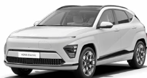
Atlas White Speciální pastelová Kombinace s černým lakováním střechy Cena: 10 000 Kč