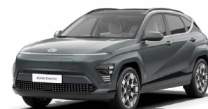
Cypress Green Perleťová Kombinace s černým lakováním střechy Cena: 17 900 Kč