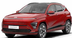
Ultimate Red Metalická Kombinace s černým lakováním střechy Cena: 17 900 Kč