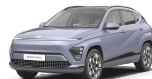
Meta Blue Pearl Metalická Kombinace s černým lakováním střechy Cena: 17 900 Kč