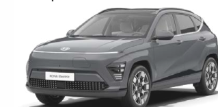
Ecotronic Gray Perleťová Kombinace s černým lakováním střechy Cena: 17 900 Kč