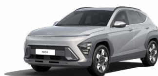
Shimmering Silver Metallic Metalická Kombinace dostupná také s černým lakováním střechy Cena: 17 900 Kč