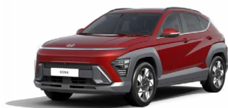
Ultimate Red Metallic Metalická Kombinace dostupná také s černým lakováním střechy Cena: 17 900 Kč