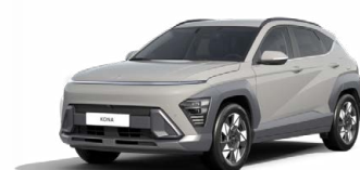
Cyber Gray Metallic Metalická Kombinace dostupná také s černým lakováním střechy Cena: 17 900 Kč