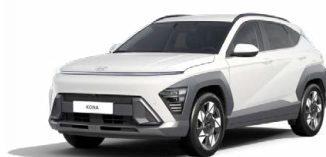
Atlas White Pastelová Kombinace dostupná také s černým lakováním střechy Cena: 9 900 Kč