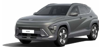
Amazon Gray Metalická Kombinace dostupná také s černým lakováním střechy Cena: 17 900 Kč