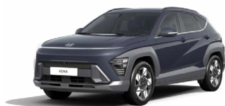
Denim Blue Pearl Perleťová Kombinace dostupná také s černým lakováním střechy Cena: 17 900 Kč