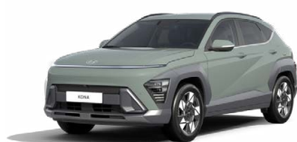
Mirage Green Pastelová Kombinace dostupná také s černým lakováním střechy Cena: 0 Kč