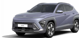
Meta Blue Pearl Perleťová Kombinace dostupná také s černým lakováním střechy Cena: 17 900 Kč