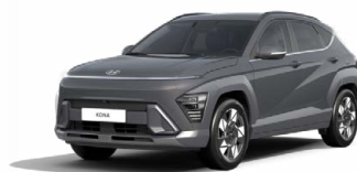
Ecotronic Gray Pearl Perleťová Kombinace dostupná také s černým lakováním střechy Cena: 17 900 Kč