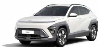
Atlas White Pastelová Kombinace dostupná také s černým lakováním střechy Cena: 9 900 Kč