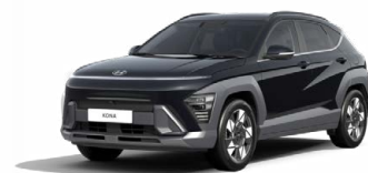
Abyss Black Pearl Perleťová Cena: 17 900 Kč