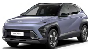
Meta Blue Pearl Perleťová Kombinace dostupná také s černým lakováním střechy Cena: 17 900 Kč