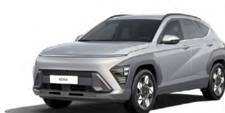
Shimmering Silver Metallic Metalická Kombinace dostupná také s černým lakováním střechy Cena: 17 900 Kč