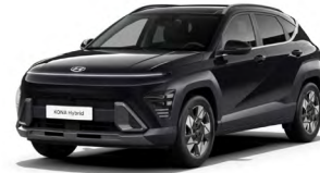
Abyss Black Pearl Perleťová Cena: 17 900 Kč