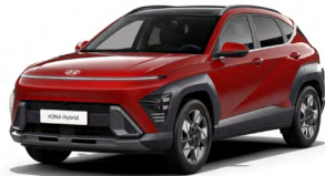
Ultimate Red Metallic Metalická Kombinace dostupná také s černým lakováním střechy Cena: 17 900 Kč