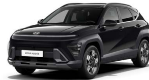
Abyss Black Pearl Perleťová Cena: 17 900 Kč