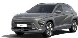
Amazon Gray Metalická Kombinace dostupná také s černým lakováním střechy Cena: 17 900 Kč