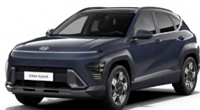
Denim Blue Pearl Perleťová Kombinace dostupná také s černým lakováním střechy Cena: 17 900 Kč