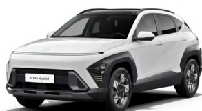
Atlas White Pastelová Kombinace dostupná také s černým lakováním střechy Cena: 9 900 Kč