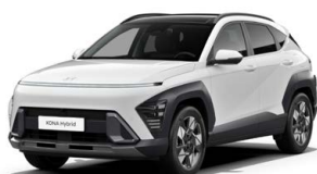
Atlas White Pastelová Kombinace dostupná také s černým lakováním střechy Cena: 9 900 Kč