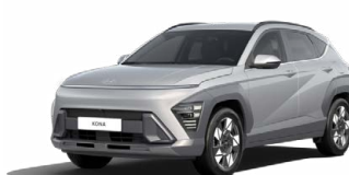
Shimmering Silver Metallic Metalická Kombinace dostupná také s černým lakováním střechy Cena: 17 900 Kč