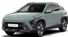
Mirage Green Pastelová Kombinace dostupná také s černým lakováním střechy Cena: 0 Kč