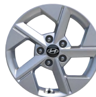
16" kola z lehké slitiny