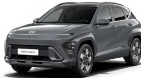
Ecotronic Gray Pearl Perleťová Kombinace dostupná také s černým lakováním střechy Cena: 17 900 Kč