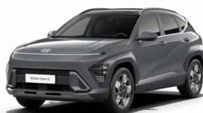
Ecotronic Gray Pearl Perleťová Kombinace dostupná také s černým lakováním střechy Cena: 17 900 Kč