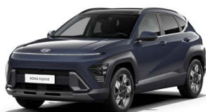
Denim Blue Pearl Perleťová Kombinace dostupná také s černým lakováním střechy Cena: 17 900 Kč