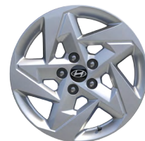
17" kola z lehké slitiny