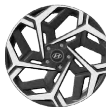
Unikátní N Line 18" kola z lehké slitiny

www.porovnejhyundai.cz (Porovnejte si vozy Hyundai s konkurencí)