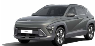
Amazon Gray Metalická Kombinace dostupná také s černým lakováním střechy Cena: 17 900 Kč