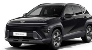
Abyss Black Pearl Perleťová Cena: 17 900 Kč