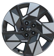
18" kola z lehké slitiny