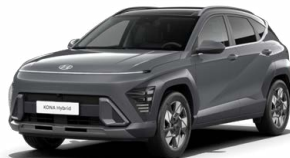
Ecotronic Gray Pearl Perleťová Kombinace dostupná také s černým lakováním střechy Cena: 17 900 Kč