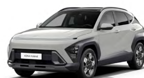
Cyber Gray Metallic Metalická Kombinace dostupná také s černým lakováním střechy Cena: 17 900 Kč