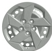
16" ocelová kola s celoplošnými kryty