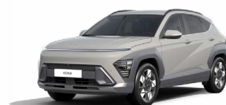
Quantum Grey Pearl Metalická Kombinace dostupná také s černým lakováním střechy Cena: 17 900 Kč