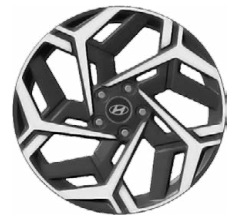
Unikátní N Line 18" kola z lehké slitiny