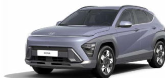
Meta Blue Pearl Perleťová Kombinace dostupná také s černým lakováním střechy Cena: 17 900 Kč