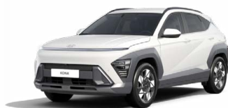
Atlas White Pastelová Kombinace dostupná také s černým lakováním střechy Cena: 9 900 Kč