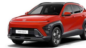
Soultronic Orange Pearl Perleťová Kombinace dostupná také s černým lakováním střechy Cena: 17 900 Kč