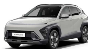
Cyber Gray Metallic Metalická Kombinace dostupná také s černým lakováním střechy Cena: 17 900 Kč