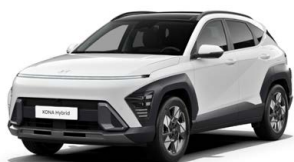
Atlas White Pastelová Kombinace dostupná také s černým lakováním střechy Cena: 9 900 Kč