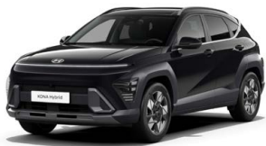
Abyss Black Pearl Perleťová Cena: 17 900 Kč