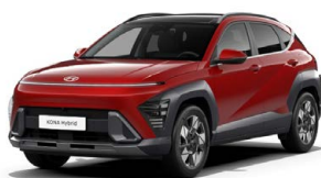
Ultimate Red Metallic Metalická Kombinace dostupná také s černým lakováním střechy Cena: 17 900 Kč