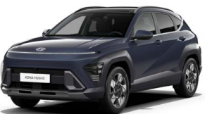
Denim Blue Pearl Perleťová Kombinace dostupná také s černým lakováním střechy Cena: 17 900 Kč