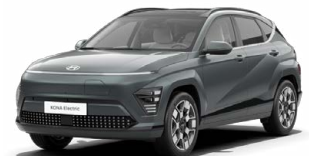
Cypress Green Perleťová Kombinace s černým lakováním střechy Cena: 17 900 Kč