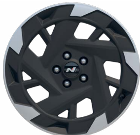
19" kola z lehké slitiny N Line