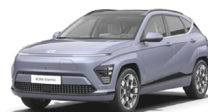
Meta Blue Pearl Metalická Kombinace s černým lakováním střechy Cena: 17 900 Kč