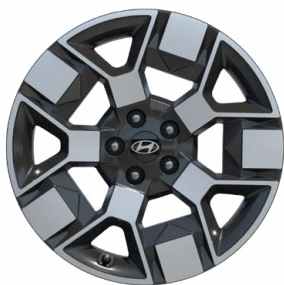
19" kola z lehké slitiny