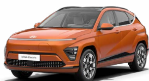
Jupiter Orange Metalická Kombinace s černým lakováním střechy Cena: 17 900 Kč