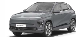
Ecotronic Gray Perleťová Kombinace s černým lakováním střechy Cena: 17 900 Kč