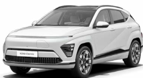
Serenity White Perleťová Kombinace s černým lakováním střechy Cena: 17 900 Kč