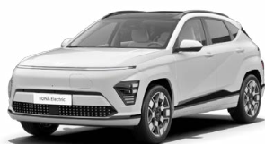
Atlas White Speciální pastelová Kombinace s černým lakováním střechy Cena: 10 000 Kč