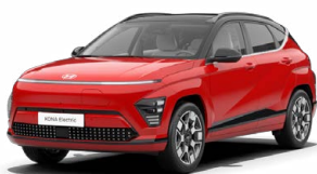
Engine Red Pastelová Kombinace s černým lakováním střechy Cena: 0 Kč