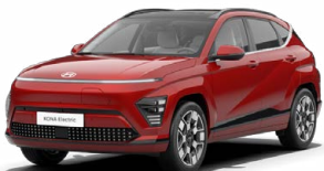
Ultimate Red Metalická Kombinace s černým lakováním střechy Cena: 17 900 Kč