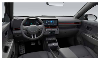
Černý interiér N Line – látkové čalounění sedadel – výhradně pro N Line