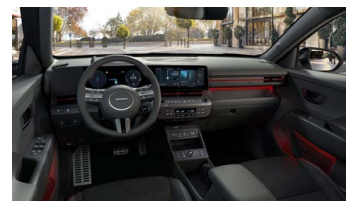
Černý interiér N Line Premium – čalounění sedadel kůže/semiš – výhradně pro N Line Premium

www.porovnejhyundai.cz (Porovnejte si vozy Hyundai s konkurencí)