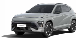
Shadow Grey Speciální pastelová Kombinace s černým lakováním střechy Cena: 17 900 Kč Pouze pro N Line