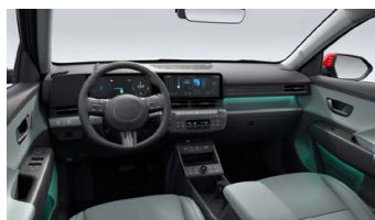
Šalvějově zelený interiér – kožené čalounění sedadel – výhradně pro Style Premium