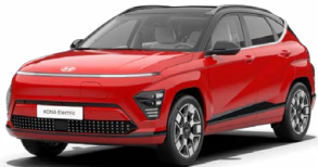
Engine Red Pastelová Kombinace s černým lakováním střechy Cena: 0 Kč