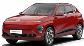
Ultimate Red Metalická Kombinace s černým lakováním střechy Cena: 17 900 Kč