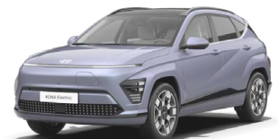
Meta Blue Pearl Metalická Kombinace s černým lakováním střechy Cena: 17 900 Kč