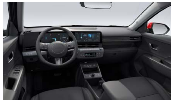
Černý interiér – látkové čalounění sedadel – dostupné pro Smart, Czech edition