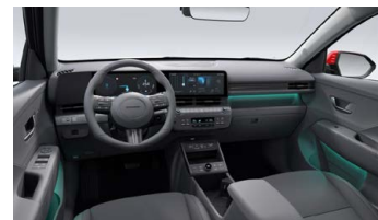
Eco interiér – čalounění sedadel kůže/semiš – výhradně pro Style