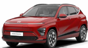
Ultimate Red Metalická Kombinace s černým lakováním střechy Cena: 17 900 Kč