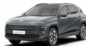
Cypress Green Perleťová Kombinace s černým lakováním střechy Cena: 17 900 Kč