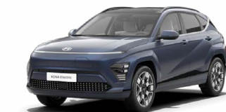
Sailing Blue Perleťová Kombinace s černým lakováním střechy Cena: 17 900 Kč