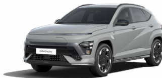
Shadow Grey Speciální pastelová Kombinace s černým lakováním střechy Cena: 17 900 Kč Pouze pro N Line