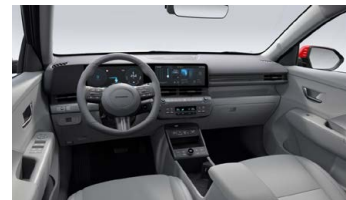
Šedý interiér – látkové čalounění sedadel – dostupné pro Smart, Czech edition