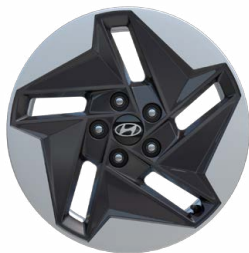
17" kola z lehké slitiny