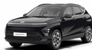
Abbyss Black Pearl Perleťová Cena: 17 900 Kč