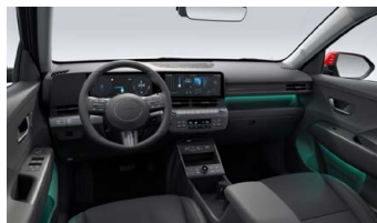
Černý interiér – čalounění sedadel kůže/látka – výhradně pro Style