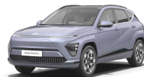
Meta Blue Pearl Metalická Kombinace s černým lakováním střechy Cena: 17 900 Kč