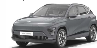
Ecotronic Gray Perleťová Kombinace s černým lakováním střechy Cena: 17 900 Kč