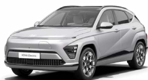
Shimmering Silver Metalická Kombinace s černým lakováním střechy Cena: 17 900 Kč