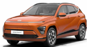
Jupiter Orange Metalická Kombinace s černým lakováním střechy Cena: 17 900 Kč