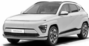
Atlas White Speciální pastelová Kombinace s černým lakováním střechy Cena: 10 000 Kč