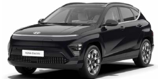
Abbyss Black Pearl Perleťová Cena: 17 900 Kč