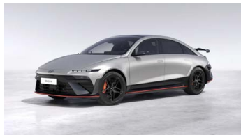
Gravity Gold Matte Matná metalická Cena: 24 900 Kč