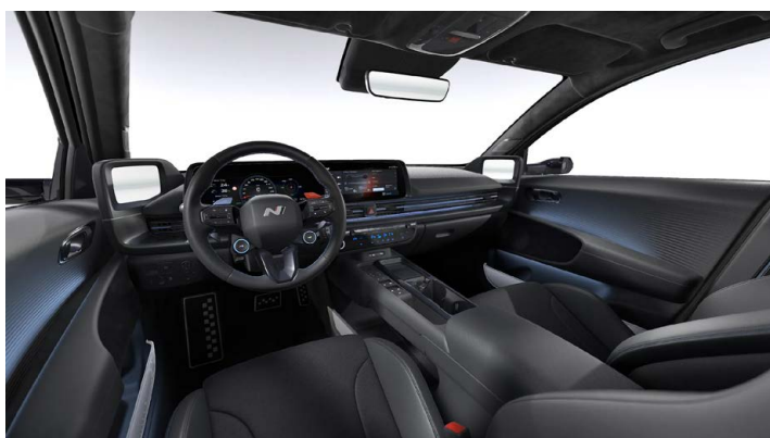
Černý interiér – čalounění sedadel kůže/látka – dostupné pro N