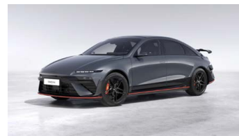
Nocturne Gray Metallic Metalická Cena: 19 900 Kč