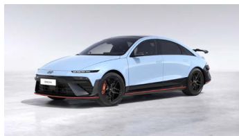
Performance Blue Pearl Perleťová Cena: 19 900 Kč