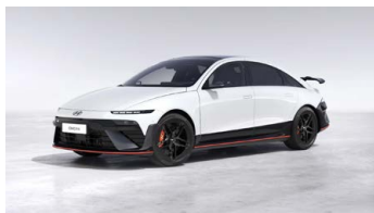
Serenity White Pearl Perleťová Cena: 0 Kč