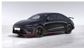
Abyss Black Pearl Perleťová Cena: 19 900 Kč