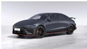
Nocturne Gray Matte Matná metalická Cena: 24 900 Kč