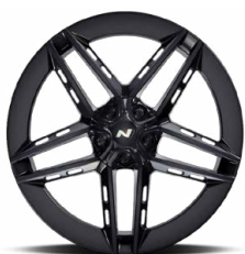
20" kovaná kola z lehké slitiny