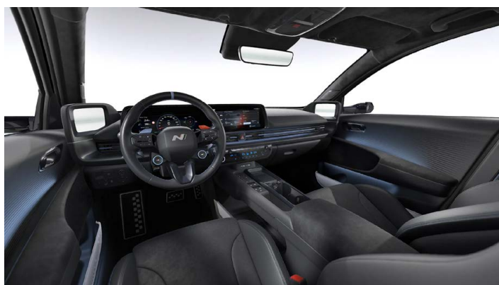
Černý interiér – čalounění sedadel Alcantara/kůže – dostupné pro N Everyday