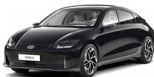
Abbys Black Pearl Perleťová Cena: 19 900 Kč