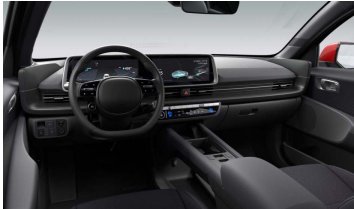
Černý interiér – látkové čalounění sedadel – dostupné pro Smart, Style