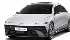
Aero Silver Metallic Metalická Cena: 19 900 Kč