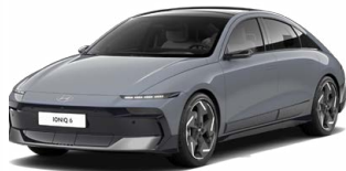
Transmission Blue Matt Matná metalická Cena: 24 900 Kč