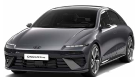
Nocturne Gray Metallic Metalická Cena: 19 900 Kč