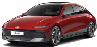
Ultimate Red Metallic Metalická Cena: 0 Kč