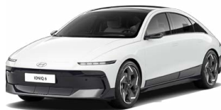
Serenity White Pearl Perleťová Cena: 19 900 Kč