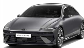
Nocturne Gray Matt Matná metalická Cena: 24 900 Kč