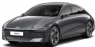
Nocturne Gray Metallic Metalická Cena: 19 900 Kč