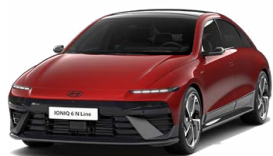
Ultimate Red Metallic Metalická Cena: 0 Kč