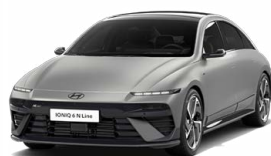
Gravity Gold Matt Matná metalická Cena: 24 900 Kč