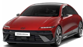
Ultimate Red Metallic Metalická Cena: 0 Kč