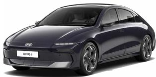
Biophilic Blue Pearl Perleťová Cena: 19 900 Kč