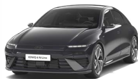
Abyss Black Pearl Perleťová Cena: 19 900 Kč