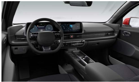
Černý interiér – látkové čalounění sedadel – dostupné pro Smart