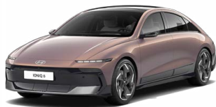
Sunset Brown Pearl Perleťová Cena: 19 900 Kč