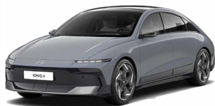
Transmission Blue Matt Matná metalická Cena: 24 900 Kč