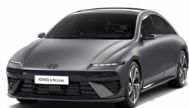
Nocturne Gray Matt Matná metalická Cena: 24 900 Kč