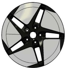
18" kola z lehké slitiny, pneumatiky 225/55 R18