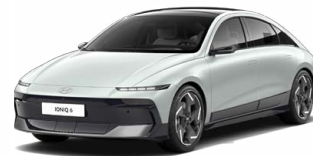
Celadon Gray Metallic Metalická Cena: 19 900 Kč