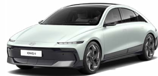
Celadon Gray Matt Matná metalická Cena: 24 900 Kč