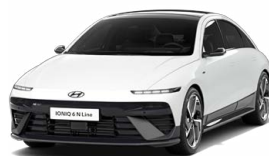
Serenity White Pearl Perleťová Cena: 19 900 Kč