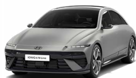
Gravity Gold Matt Matná metalická Cena: 24 900 Kč