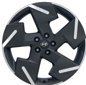
20" kola z lehké slitiny, pneumatiky 245/40 R20