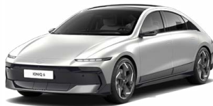
Gravity Gold Matt Matná metalická Cena: 24 900 Kč