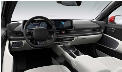
Šedý interiér – kožené čalounění sedadel – dostupné pro Premium