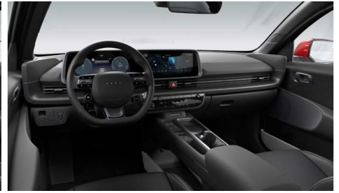
Černý interiér – kožené čalounění sedadel – dostupné pro Premium