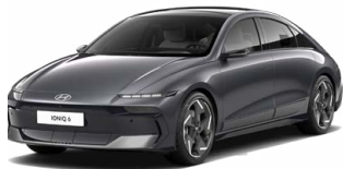
Nocturne Gray Metallic Metalická Cena: 19 900 Kč