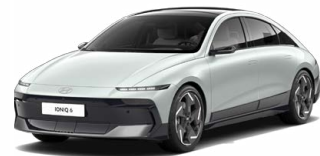
Celadon Gray Metallic Metalická Cena: 19 900 Kč