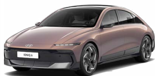
Sunset Brown Pearl Perleťová Cena: 19 900 Kč