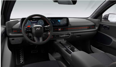
Černý interiér – čalounění sedadel v kombinaci kůže/semiš – dostupné pro N Line