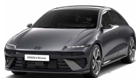
Nocturne Gray Metallic Metalická Cena: 19 900 Kč