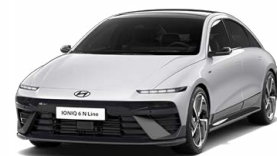
Aero Silver Metallic Metalická Cena: 19 900 Kč