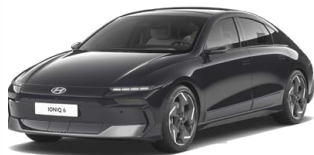
Abyss Black Pearl Perleťová Cena: 19 900 Kč