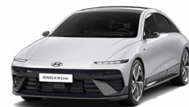
Aero Silver Metallic Metalická Cena: 19 900 Kč