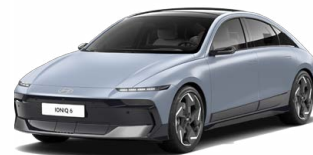
Transmission Blue Pearl Perleťová Cena: 19 900 Kč