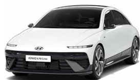
Serenity White Pearl Perleťová Cena: 19 900 Kč