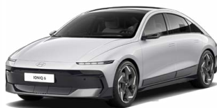
Aero Silver Metallic Metalická Cena: 19 900 Kč