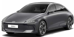
Nocturne Gray Matt Matná metalická Cena: 24 900 Kč