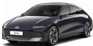
Biophilic Blue Pearl Perleťová Cena: 19 900 Kč