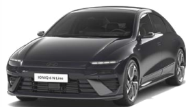
Abyss Black Pearl Perleťová Cena: 19 900 Kč