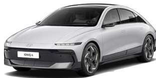
Aero Silver Metallic Metalická Cena: 19 900 Kč