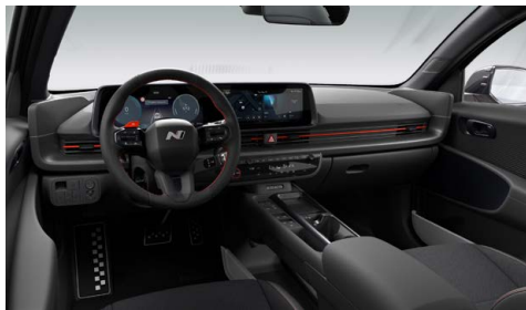
Černý interiér – čalounění sedadel v kombinaci kůže/semiš – dostupné pro N Line