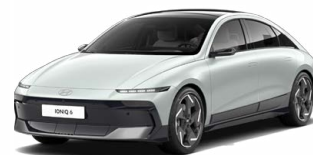
Celadon Gray Metallic Metalická Cena: 19 900 Kč