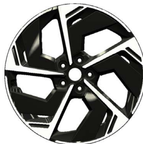
20" kola z lehké slitiny N Line, pneumatiky 245/40 R20