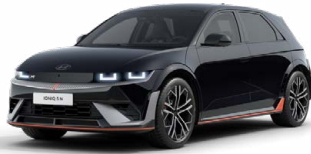
Abbyss Black Pearl Perleťová Cena: 19 900 Kč