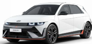
Atlas White Speciální pastelová Cena: 11 900 Kč