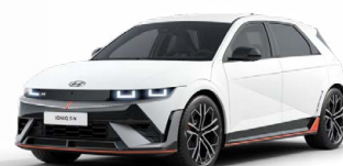
Atlas White Matná metalická Cena: 24 900 Kč