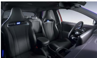
Černý interiér – čalounění sedadel kůže/látka – dostupné pro N