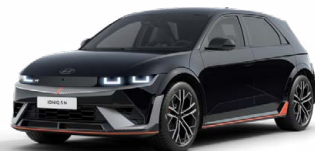
Abbyss Black Pearl Perleťová Cena: 19 900 Kč