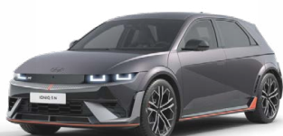
Ecotronic Gray Perleťová Cena: 19 900 Kč