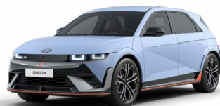
Performance Blue Pastelová Cena: 19 900 Kč