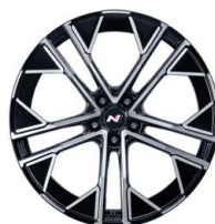
21" kovaná kola z lehké slitiny