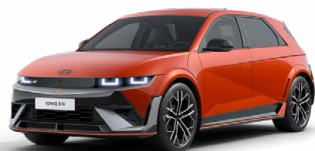
Soultronic Orange Perleťová Cena: 0 Kč