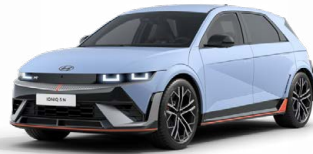
Performance Blue Pastelová Cena: 19 900 Kč