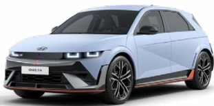
Performance Blue Matná metalická Cena: 24 900 Kč