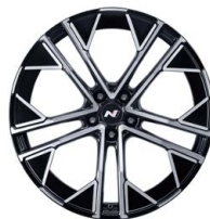
21" kovaná kola z lehké slitiny