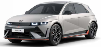
Cyber Gray Metalická Cena: 19 900 Kč