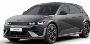
Ecotronic Gray Matná metalická Cena: 24 900 Kč