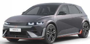
Ecotronic Gray Perleťová Cena: 19 900 Kč