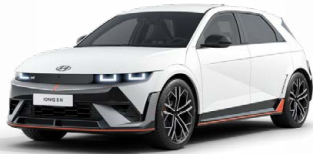
Atlas White Speciální pastelová Cena: 11 900 Kč