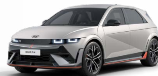
Cyber Gray Metalická Cena: 19 900 Kč