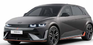
Ecotronic Gray Matná metalická Cena: 24 900 Kč