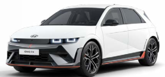
Atlas White Matná metalická Cena: 24 900 Kč