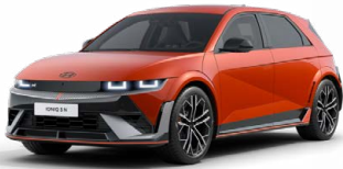
Soultronic Orange Perleťová Cena: 0 Kč