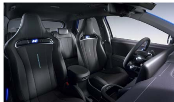
Černý interiér – čalounění sedadel Alcantara/ kůže – dostupné pro N Everyday