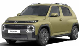
Amazonas Green Matte Matná metalická Cena: 15 900 Kč Pouze pro Cross Premium Kombinace dostupná také s černým lakováním střechy