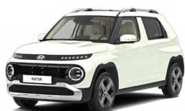
Unbleached Ivory Pastelová Cena: 0 Kč