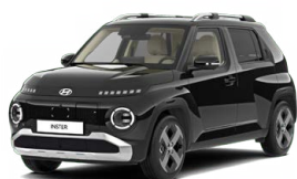
Abyss Black Pearl Perleťová Cena: 12 900 Kč