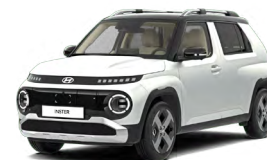
Aero Silver Matte Matná metalická Cena: 15 900 Kč Kombinace dostupná také s černým lakováním střechy