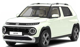
Unbleached Ivory Pastelová Cena: 0 Kč