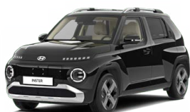
Abyss Black Pearl Perleťová Cena: 12 900 Kč