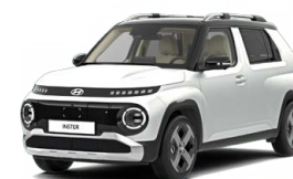
Aero Silver Matte Matná metalická Cena: 15 900 Kč Pouze pro skladové vozy