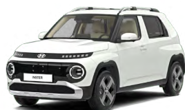
Atlas White Pastelová Cena: 6 900 Kč Kombinace dostupná také s černým lakováním střechy