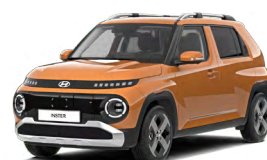
Sienna Orange Metallic Metalická Cena: 12 900 Kč Nelze pro INSTER Cross, INSTER Cross Premium Kombinace dostupná také s černým lakováním střechy