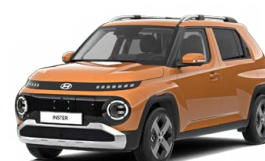
Sienna Orange Metallic Metalická Cena: 12 900 Kč Nelze pro Cross, Cross Premium