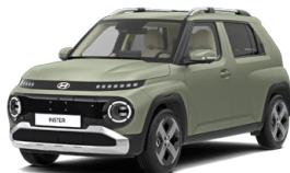
Bijarim Khaki Matte Matná metalická Cena: 15 900 Kč Nelze pro INSTER Cross, INSTER Cross Premium