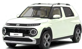
Unbleached Ivory Patelová Cena: 0 Kč