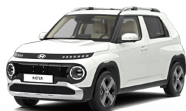
Atlas White Pastelová Cena: 6 900 Kč Kombinace dostupná také s černým lakováním střechy