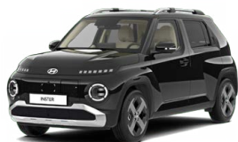
Abyss Black Pearl Perleťová Cena: 12 900 Kč