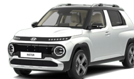
Aero Silver Matte Matná metalická Cena: 15 900 Kč Kombinace dostupná také s černým lakováním střechy