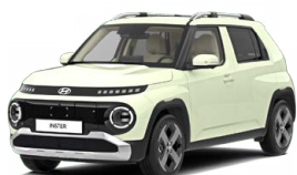
Buttercream Yellow Pearl Perleťová Cena: 12 900 Kč Nelze pro Cross, Cross Premium