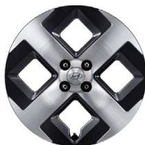
17" kola z lehké slitiny