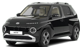
Abyss Black Pearl Perleťová Cena: 12 900 Kč