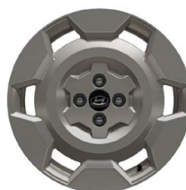
17" kola z lehké slitiny INSTER Cross