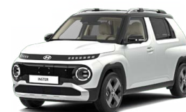
Aero Silver Matte Matná metalická Cena: 15 900 Kč Pouze pro skladové vozy