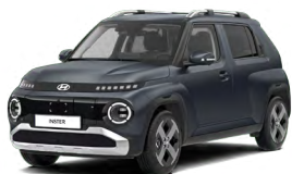
Dusk Blue Matte Matná metalická Cena: 15 900 Kč Nelze pro INSTER Cross, INSTER Cross Premium