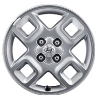
15" kola z lehké slitiny