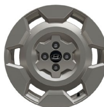
17" kola z lehké slitiny INSTER Cross

www.porovnejhyundai.cz (Porovnejte si vozy Hyundai s konkurencí)