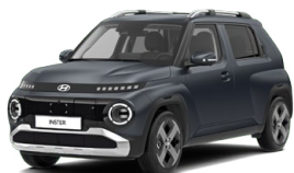
Dusk Blue Matte Matná metalická Cena: 15 900 Kč Nelze pro INSTER Cross, INSTER Cross Premium