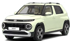
Buttercream Yellow Pearl Perleťová Cena: 12 900 Kč Nelze pro INSTER Cross, INSTER Cross Premium