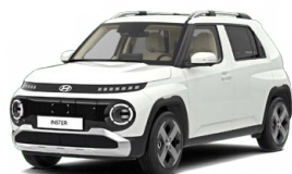
Atlas White Pastelová Cena: 6 900 Kč Kombinace dostupná také s černým lakováním střechy