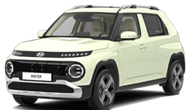
Buttercream Yellow Pearl Perleťová Cena: 12 900 Kč Nelze pro INSTER Cross, INSTER Cross Premium