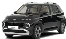
Abyss Black Pearl Perleťová Cena: 12 900 Kč