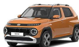
Sienna Orange Metallic Metalická Cena: 12 900 Kč Nelze pro INSTER Cross, INSTER Cross Premium Kombinace dostupná také s černým lakováním střechy