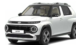
Aero Silver Matte Matná metalická Cena: 15 900 Kč Kombinace dostupná také s černým lakováním střechy