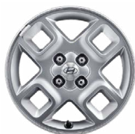
15" kola z lehké slitiny