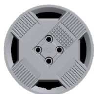
15" ocelová kola s celoplošnými kryty