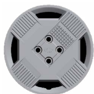
15" ocelová kola s celoplošnými kryty