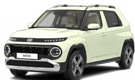
Buttercream Yellow Pearl Perleťová Cena: 12 900 Kč Nelze pro INSTER Cross, INSTER Cross Premium