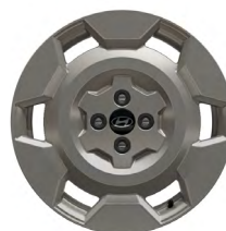
17" kola z lehké slitiny INSTER Cross

www.porovnejhyundai.cz (Porovnejte si vozy Hyundai s konkurencí)