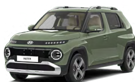
Tomboy Khaki Pastelová Cena: 12 900 Kč Kombinace dostupná také s černým lakováním střechy