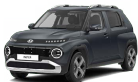
Dusk Blue Matte Matná metalická Cena: 15 900 Kč Nelze pro INSTER Cross, INSTER Cross Premium