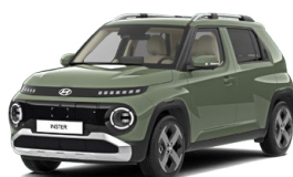
Tomboy Khaki Pastelová Cena: 12 900 Kč Kombinace dostupná také s černým lakováním střechy