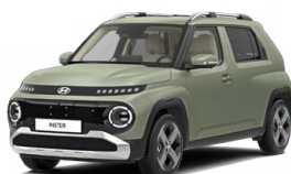
Bijarim Khaki Matte Matná metalická Cena: 15 900 Kč Nelze pro Cross, Cross Premium Pouze pro skladové vozy