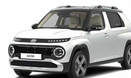
Aero Silver Matte Matná metalická Cena: 15 900 Kč Pouze pro skladové vozy