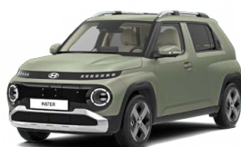
Bijarim Khaki Matte Matná metalická Cena: 15 900 Kč Nelze pro Cross, Cross Premium Pouze pro skladové vozy