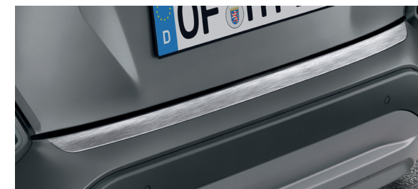
Modanatura del paraurti posteriore, finitura spazzolata