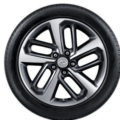
7. Kit cerchio in lega da 18"