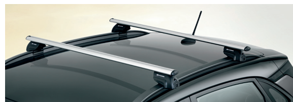
Barre portatutto, alluminio