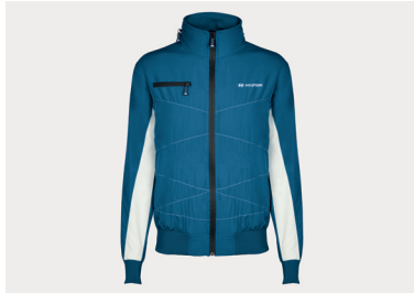
Giacca a vento, unisex