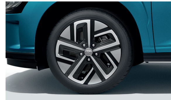
1. Kit cerchio in lega da 17"