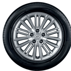
3. Kit cerchio in lega da 17"