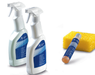
Kit cura per l'estate