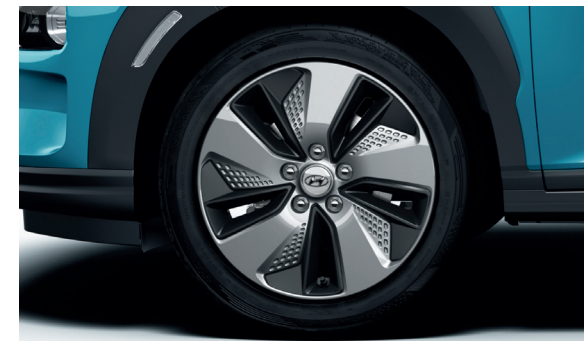
2. Kit cerchio in lega da 17"