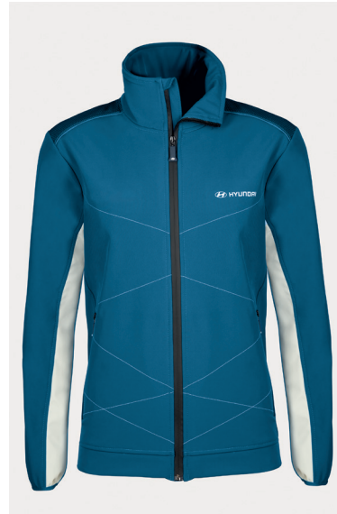
Giubbotto softshell, uomo