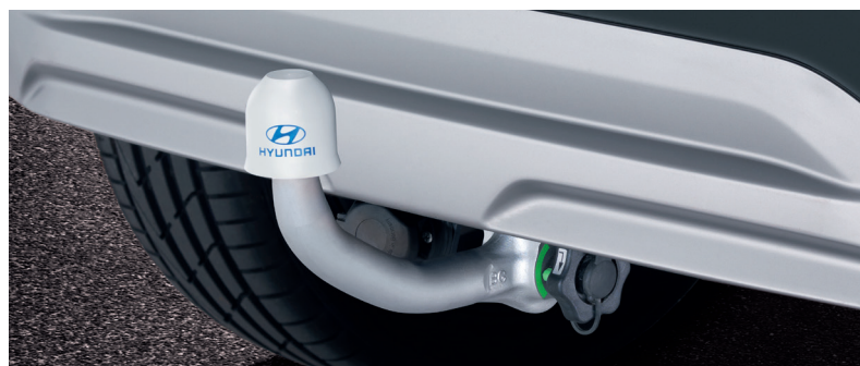
Gancio di traino rimovibile

La massima capacità di traino dipende dalle specifiche della vettura. Consultare il proprio concessionario per ulteriori informazioni. Tutti i ganci di traino Originali per Hyundai KONA sono resistenti alla corrosione, certificati mediante il test in nebbia salina ISO 9227NSS e conformi ai requisiti OE Car Loading Standard (CARLOS) - Trailer Coupling (TC) e Bike Carrier (BC).