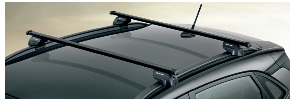
Barre portatutto, acciaio