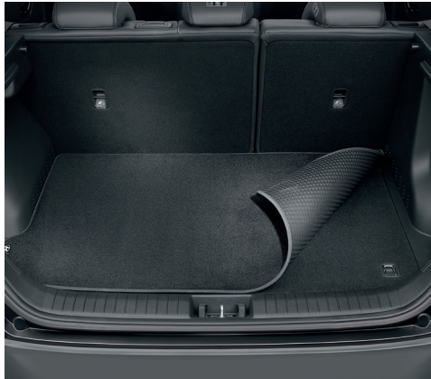
Tappeto per baule, reversibile