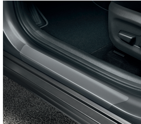
Pellicole protettive per soglie battitacco, trasparenti (anteriori)