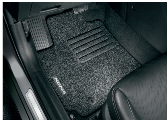
Tappetini in tessuto standard