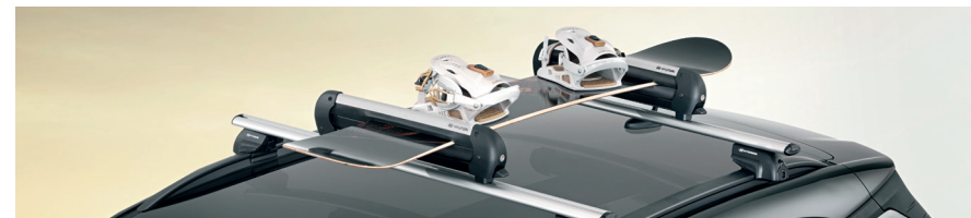
Portasci e snowboard 400