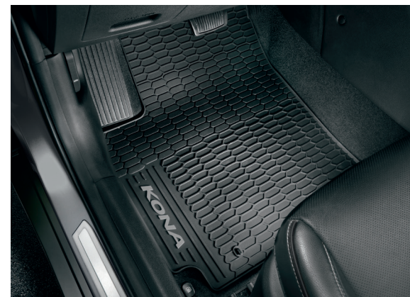
Tappetini "all weather", con logo grigio