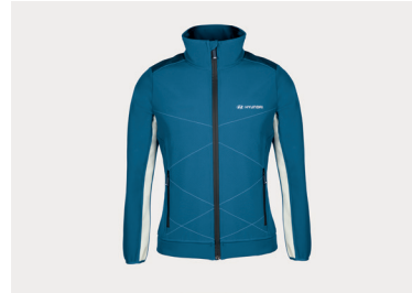
Giubbotto softshell, donna