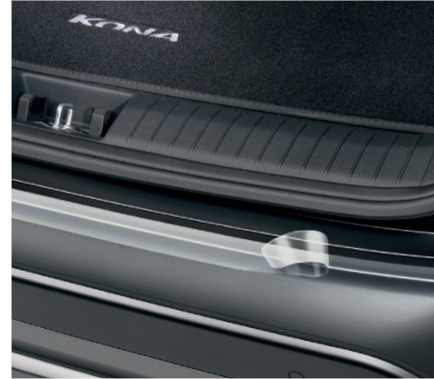
Pellicola protettiva paraurti posteriore, trasparente