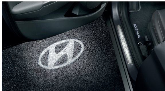
Proiettori portiera a LED, logo Hyundai

J9651ADE00 (kit di collegamento a LED aggiuntivo non necessario)