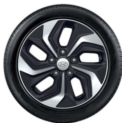
2. Kit cerchio in lega da 16" (solo HEV)