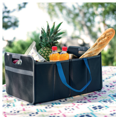
Organizer per baule, ripiegabile