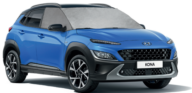
Protezione da ghiaccio/sole

Offri a tutti una piacevole escursione con qualche speciale aggiunta abbinata al tuo spirito e a quello della tua nuova KONA.