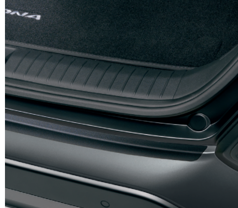
Pellicola protettiva paraurti posteriore, nero