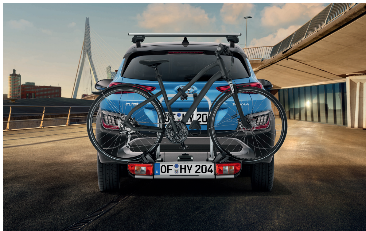
Portabici per tutti i ganci di traino