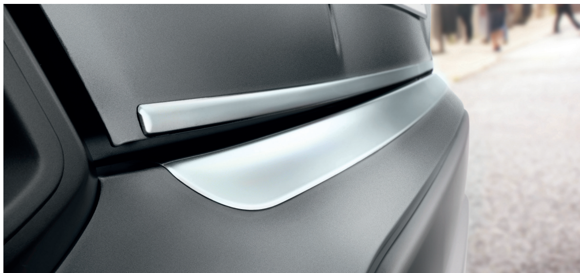
Linea di rivestimento del portellone, finitura cromata e Modanatura del paraurti posteriore, finitura cromata