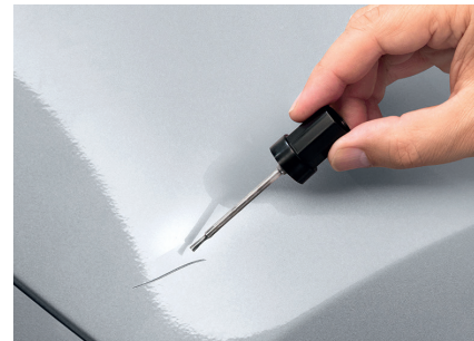
Vernici per ritocchi