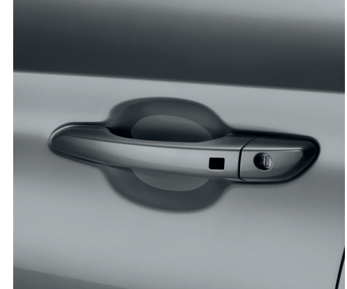
Pellicola protettiva maniglia