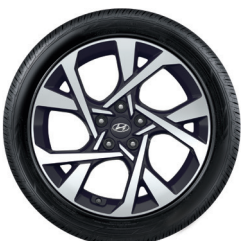
9. Kit cerchio in lega da 18"