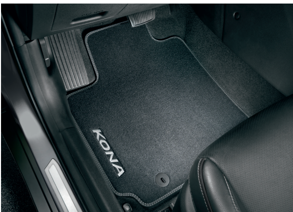
Tappetini in velluto