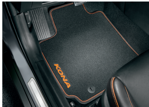
Tappetini in velluto, con dettagli in arancione