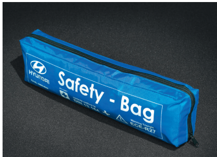
Borsa con kit di sicurezza