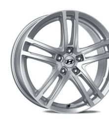
6. Cerchio in lega da 17"