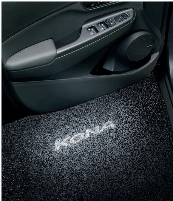
Proiettori portiera a LED, logo KONA

Aggiungi il tuo tocco personale con questi Accessori dedicati allo stile, per sorprendere tutti con l'aspetto decisamente unico della tua KONA.