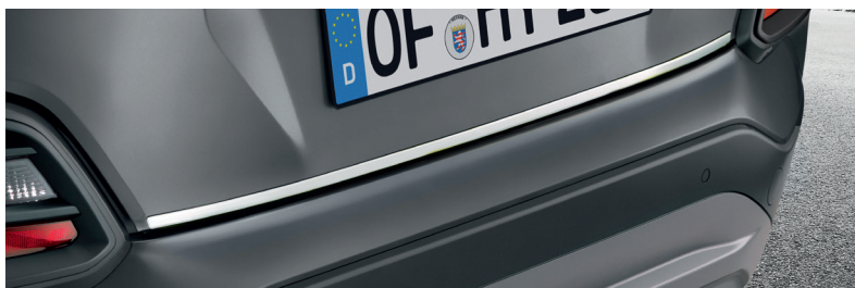
Linea di rivestimento del portellone, finitura cromata