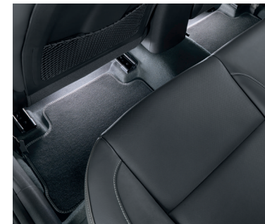
Illuminazione a LED zona piedi, bianca, seconda fila