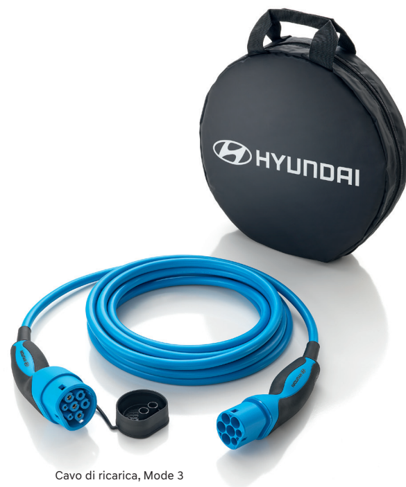
Cavo di ricarica, Mode 3

Ricaricare rapidamente la tua nuova KONA Electric non potrebbe essere più facile, intelligente e veloce. Il cavo di ricarica di alta qualità Mode 3 è progettato e studiato per funzionare senza problemi e per sopportare forti sollecitazioni e condizioni climatiche estreme.