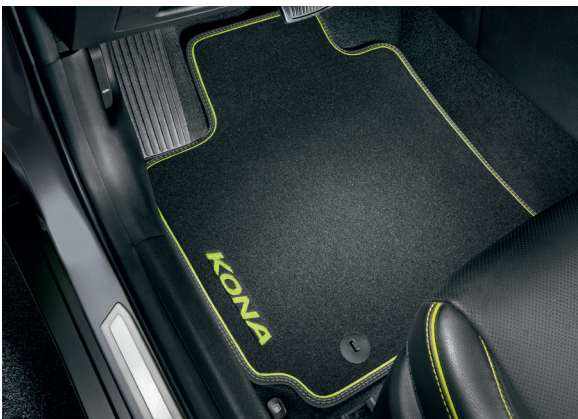
Tappetini in velluto, con dettagli in verde