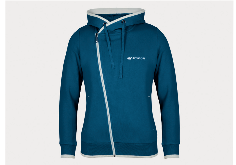
Giubbotto felpato, donna