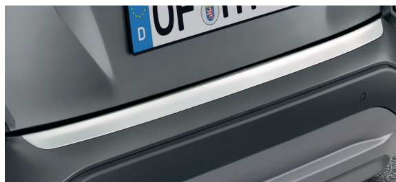
Modanatura del paraurti posteriore, finitura cromata