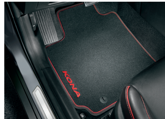
Tappetini in velluto, con dettagli in rosso