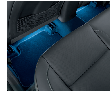
Illuminazione a LED zona piedi, blu, seconda fila