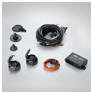
Kit cablaggio per gancio di traino