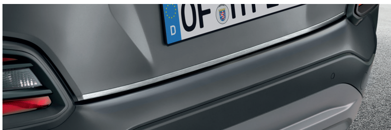
Linea di rivestimento del portellone, finitura spazzolata