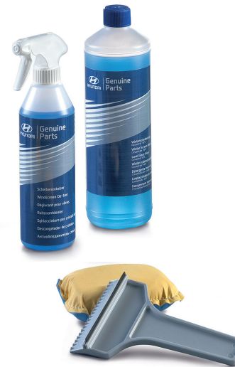
Kit cura per l'inverno