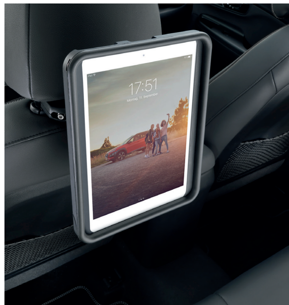
Supporto Entertainment sedili posteriori per iPad®