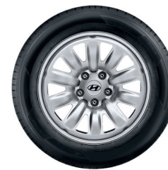
12. Cerchio in acciaio da 17"