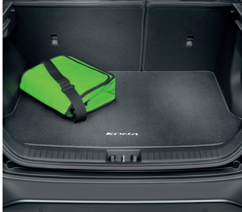
Tappeto per baule