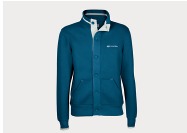
Cardigan felpato, uomo