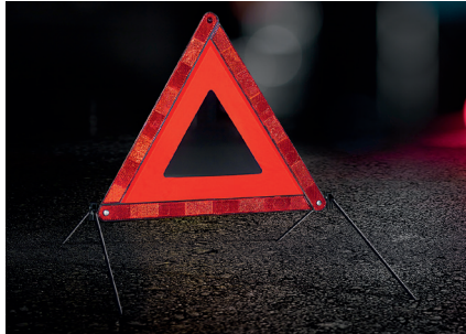
Triangolo di emergenza