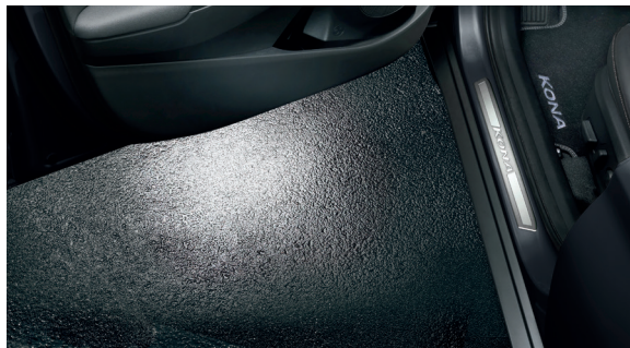
Luci sottoporta a LED