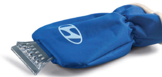
Raschiaghiaccio con guanto