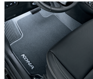
Illuminazione a LED zona piedi, bianca, prima fila

99651ADE90 (kit cavo aggiuntivo da acquistare separatamente)