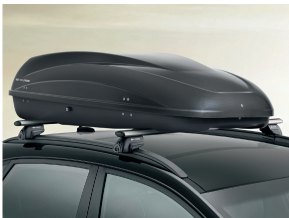
Box da tetto 330