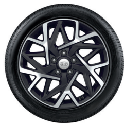
8. Kit cerchio in lega da 18" (solo HEV)