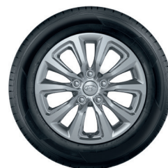
11. Kit copricerchi per cerchi in acciaio da 16"