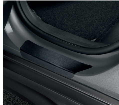
Pellicole protettive per soglie battitacco, nere (posteriori)