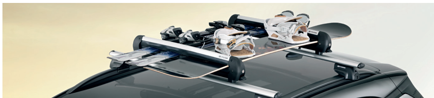
Portasci e snowboard 600

La tua KONA è nata per il divertimento all'aperto. Aggiungi ciò che serve per adattarla alle necessità della tua vita all'aperto.