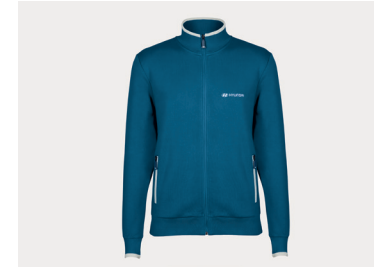
Giubbotto felpato, uomo