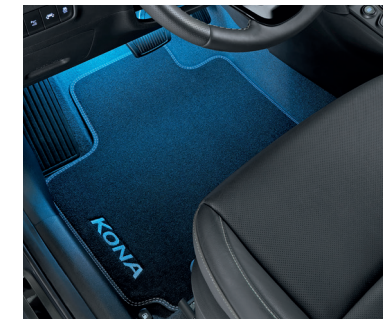
Illuminazione a LED zona piedi, blu, prima fila