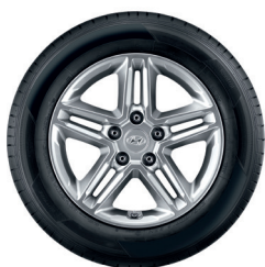
1. Kit cerchio in lega da 16"

Cerchi in lega originali che danno alla tua KONA quel tocco classico o originale in più.