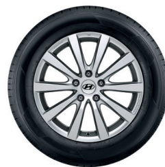
4. Cerchio in lega da 17" Halla