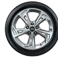
5. Cerchio in lega da 17"