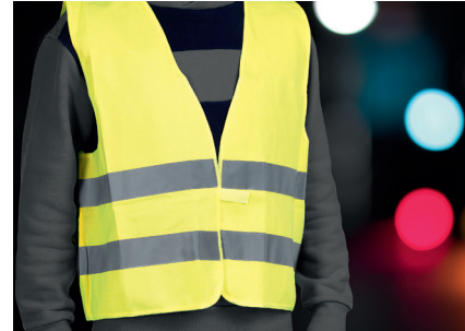
Gilet ad alta visibilità