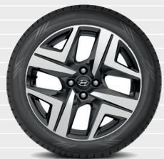
Vertex® Jantes en alliage léger 17" 205/55 R17