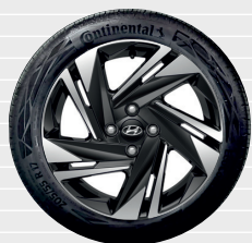
Amplia® Jantes en alliage léger 16" 195/55 R16