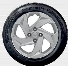
Pica® / Origo® Jantes en tôle avec enjoliveurs 15" 185/65 R15