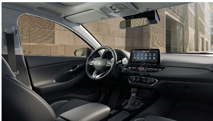
Černý interiér Oceanic Black – látkové čalounění sedadel – světlé čalounění stropu a obložení bočních sloupků – černé provedení přístrojové desky a výplní dveří