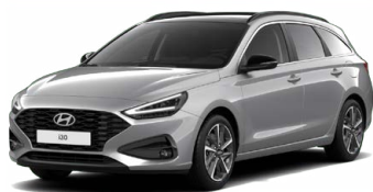
Shimmering Silver Metallic Metalická Cena: 16 900 Kč