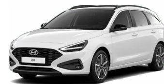
Serenity White Pearl Perleťová Cena: 16 900 Kč