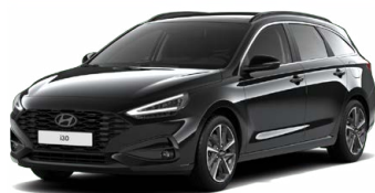
Abyss Black Pearl Perleťová Cena: 16 900 Kč