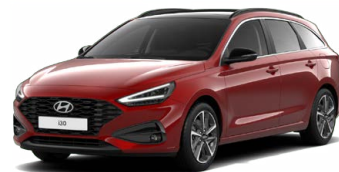
Ultimate Red Metallic Metalická Cena: 16 900 Kč