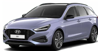
Meta Blue Pearl Perleťová Cena: 16 900 Kč