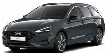
Cypress Green Pearl Perleťová Cena: 16 900 Kč