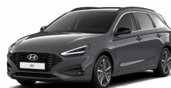
Ecotronic Gray Pearl Perleťová Cena: 16 900 Kč