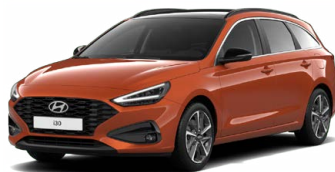
Jupiter Orange Metallic Metalická Cena: 16 900 Kč