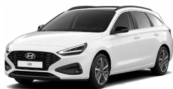
Atlas White Pastelová Cena: 5 900 Kč