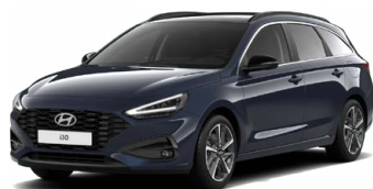
Sailing Blue Pearl Perleťová Cena: 16 900 Kč