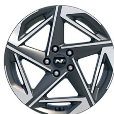
18" kola z lehké slitiny – GO Czech N Line!