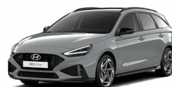
Shadow Gray Pastelová Cena: 16 900 Kč Dostupný pouze pro GO Czech N Line!