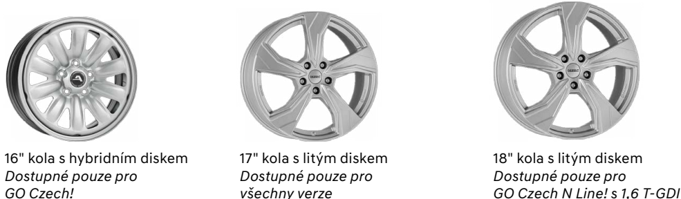
16" kola s hybridním diskem Dostupné pouze pro GO Czech!