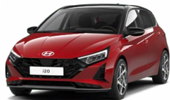
Dragon Red Pearl Perleťová Cena: 13 900 Kč