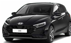
Phantom Black Pearl Perleťová Cena: 13 900 Kč