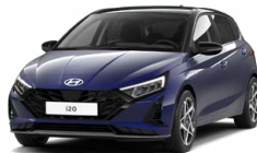
Vibrant Blue Pearl Perleťová Cena: 13 900 Kč