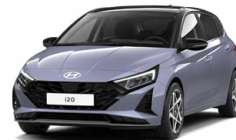
Meta Blue Pearl Metalická Cena: 13 900 Kč