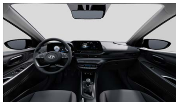
Černý Obsidian Black interiér – černé čalounění sedadel – světlé čalounění stropu a obložení bočních sloupků – černé provedení přístrojové desky a středové konzoly – černé provedení výplní dveří