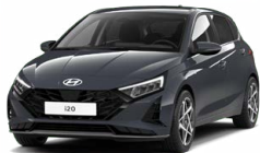
Aurora Gray Pearl Perleťová Cena: 13 900 Kč