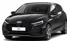
Phantom Black Pearl Perleťová Cena: 13 900 Kč