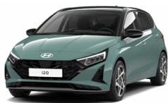
Mangroove Green Pearl Perleťová Cena: 0 Kč