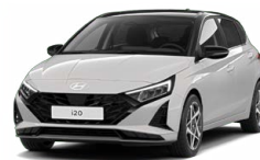
Lumen Gray Pearl Perleťová Cena: 13 900 Kč