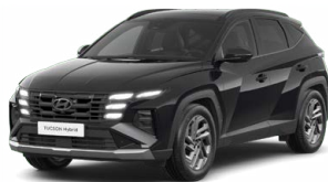
Abyss Black Pearl Perleťová Cena: 0 Kč