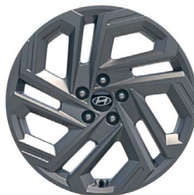
19" kola z lehké slitiny