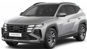
Shimmering Silver Metallic Metalická Cena: 0 Kč