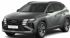
Pine Green Matt Matná Cena: 15 000 Kč