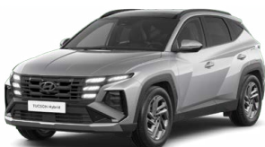
Shimmering Silver Metallic Metalická Cena: 0 Kč