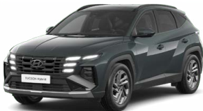
Cypress Green Pearl Perleťová Cena: 0 Kč