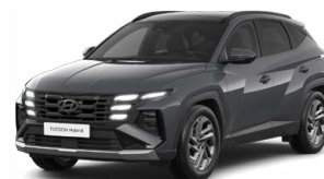
Ecotronic Gray Pearl Perleťová Cena: 0 Kč