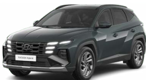
Cypress Green Pearl Perleťová Cena: 0 Kč