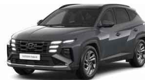
Ecotronic Gray Pearl Perleťová Cena: 0 Kč