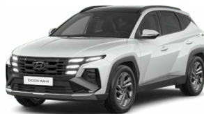
Serenity White Pearl Perleťová Cena: 0 Kč