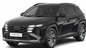
Abyss Black Pearl Perleťová Cena: 0 Kč