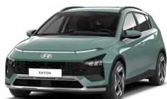
Mangroove Green Pearl Perleťová Kombinace s černým lakováním střechy Cena: 13 900 Kč