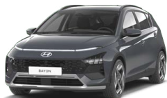
Aurora Gray Pearl Perleťová Cena: 13 900 Kč