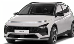
Lumen Gray Pearl Perleťová Kombinace s černým lakováním střechy Cena: 13 900 Kč