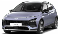
Meta Blue Pearl Metalická Kombinace s černým lakováním střechy Cena: 13 900 Kč