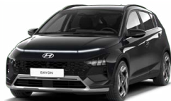
Phantom Black Pearl Perleťová Cena: 13 900 Kč