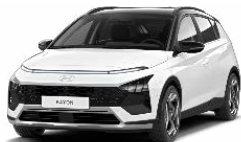
Atlas White Speciální pastelová Kombinace s černým lakováním střechy Cena: 5 000 Kč