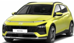
Lucid Lime Metallic Metalická Kombinace s černým lakováním střechy Cena: 0 Kč