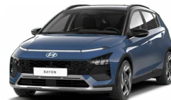
Vibrant Blue Pearl Perleťová Kombinace s černým lakováním střechy Cena: 13 900 Kč