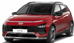
Dragon Red Pearl Perleťová Kombinace s černým lakováním střechy Cena: 13 900 Kč