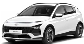
Atlas White Speciální pastelová Cena: 5 000 Kč