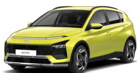
Lucid Lime Metallic Metalická Cena: 13 900 Kč