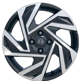
16" kola z lehké slitiny