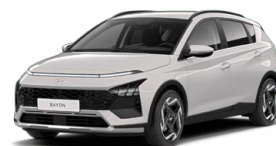
Lumen Gray Pearl Perleťová Cena: 13 900 Kč