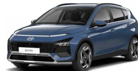
Vibrant Blue Pearl Perleťová Cena: 13 900 Kč