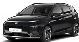
Phantom Black Pearl Perleťová Cena: 13 900 Kč