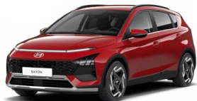
Dragon Red Pearl Perleťová Cena: 13 900 Kč