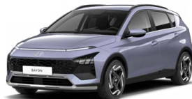
Meta Blue Pearl Metalická Cena: 13 900 Kč