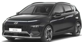
Aurora Gray Pearl Perleťová Cena: 13 900 Kč