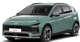
Mangroove Green Pearl Perleťová Cena: 0 Kč