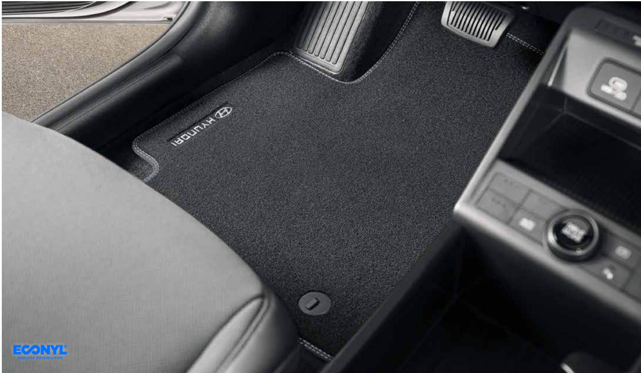
2b. Mattenset velours met Hyundai-logo

ECONYL® geregenereerd nylon is in 2011 geïntroduceerd. Het wordt gemaakt van afval uit zeeën en oceanen en van stortafval, zoals industrieel plastic, textielresten van kledingfabrikanten, oude tapijten en oude visnetten. Het afval wordt vervolgens gereinigd en omgezet in ECONYL®, een geregenereerd nylongaren. Het is precies hetzelfde als gloednieuw nylon en kan keer op keer worden gerecycled.