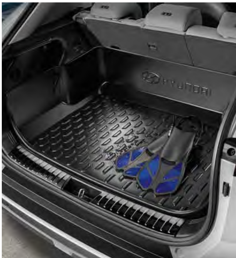
2. Bagagebak 'Heavy Duty'

Met volle teugen genieten van het leven is zoveel makkelijker met de KONA. Modder of ander vuil? Onze speciaal ontworpen accessoires bieden het hele jaar door bescherming en passen perfect in het interieur. Ze hebben vaak dezelfde oppervlaktepatronen en zijn waar mogelijk gemaakt van bio-based materialen.