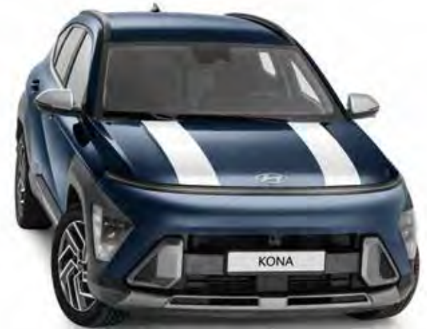
3b. Striping 'Racing stripes', hoogglans wit