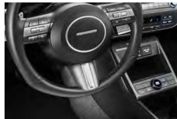
1. Accenten op stuurwiel

Geef de flanken van je Hyundai KONA nog meer dynamiek met deze sierlijsten in geborsteld aluminium.