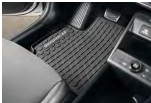
4. Mattenset All weather