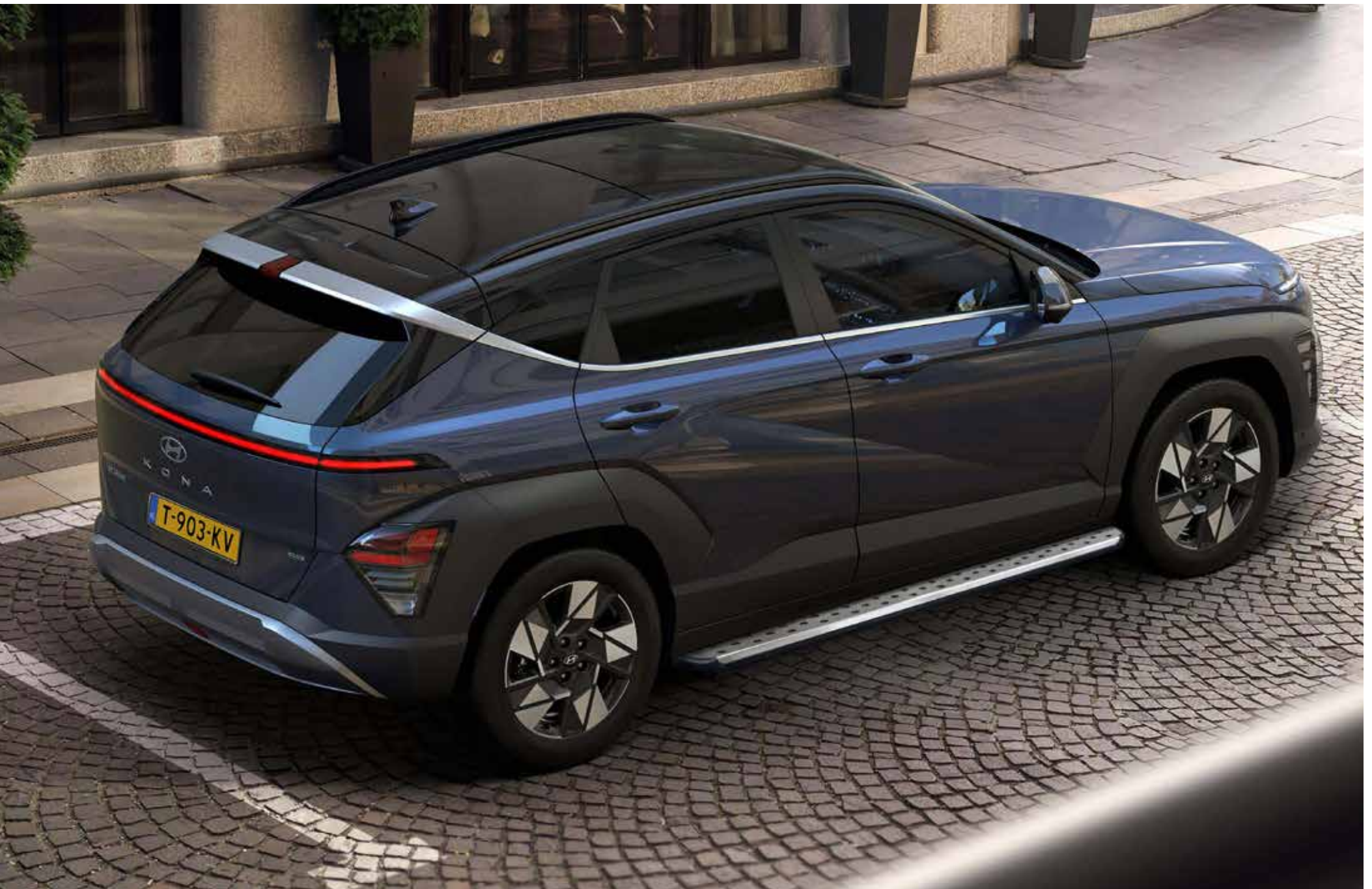
1. Sidestepset met RVS-inlay