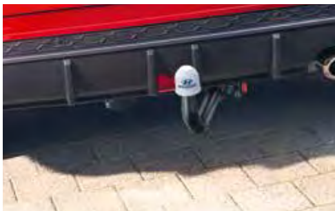
2c. Afneembare trekhaak (KONA Hybrid N Line)