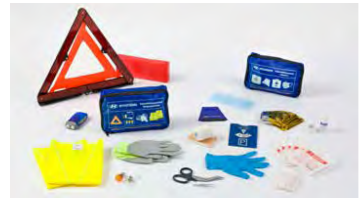
5. Calamiteitenpakket DUO