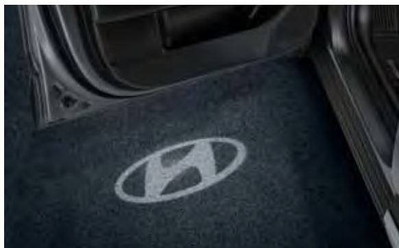
2a. LED-uitstapverlichting met Hyundai-logo