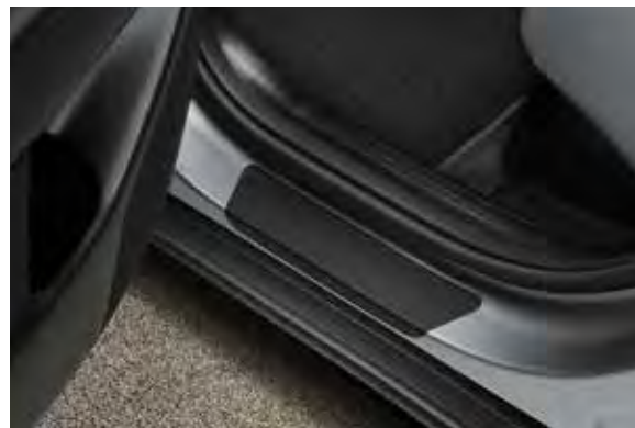
3b. Instapbeschermfolie zwart