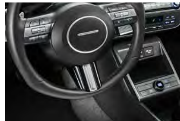
1. Accenten op stuurwiel

Geef de flanken van je Hyundai KONA nog meer dynamiek met deze pianozwarte sierlijsten.