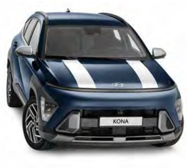
3b. Striping 'Racing stripes', hoogglans wit