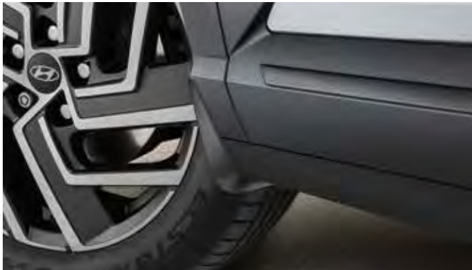
2a. Spatlappenset voor

Met dit Calamiteitenpakket heb je altijd snel het benodigde bij de hand bij een calamiteit, omdat het uit 2 pakketten bestaat! Het interieurdeel bestaat uit: een door het Oranje Kruis goedgekeurde verkeersverbandset, een mondkapje, een ijskrabber en een parkeerschijf met aan de andere zijde een eindelaadtijd-indicatie. Het bagageruimtegedeelte bestaat uit: een goedgekeurde gevarendriehoek, een LED-knijplamp, 2 veiligheidsvestjes, een reservelampenset en een set handschoenen.