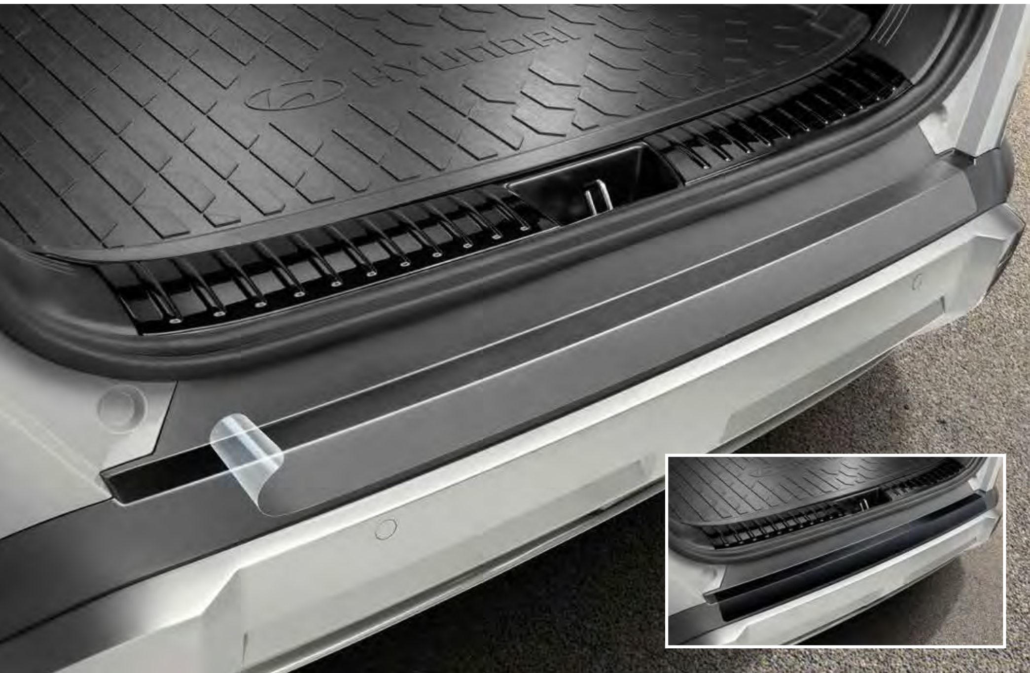
Bumperbeschermfolie transparant (1a, grote foto) en zwart (1b, inzetje)