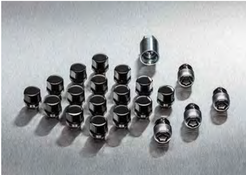
10. Wielmoerenset in Dark Chrome