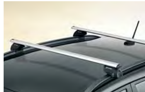
4. Dakdragerset, aluminium (leverbaar medio 2024)