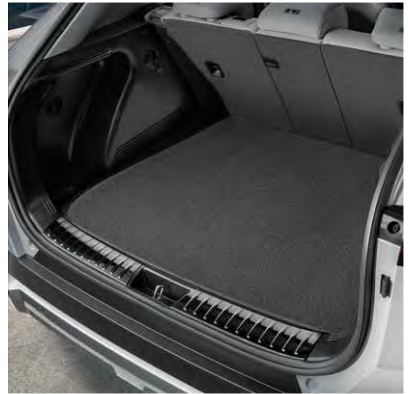
4. Kofferbakmat (omkeerbaar)