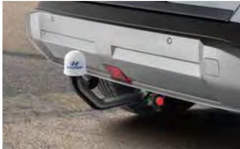
2a. Afneembare trekhaak (KONA Mild-Hybrid en KONA Hybrid)