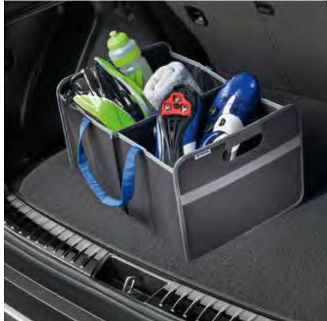
2. Kofferbakorganizer 'Hyundai' (opvouwbaar)