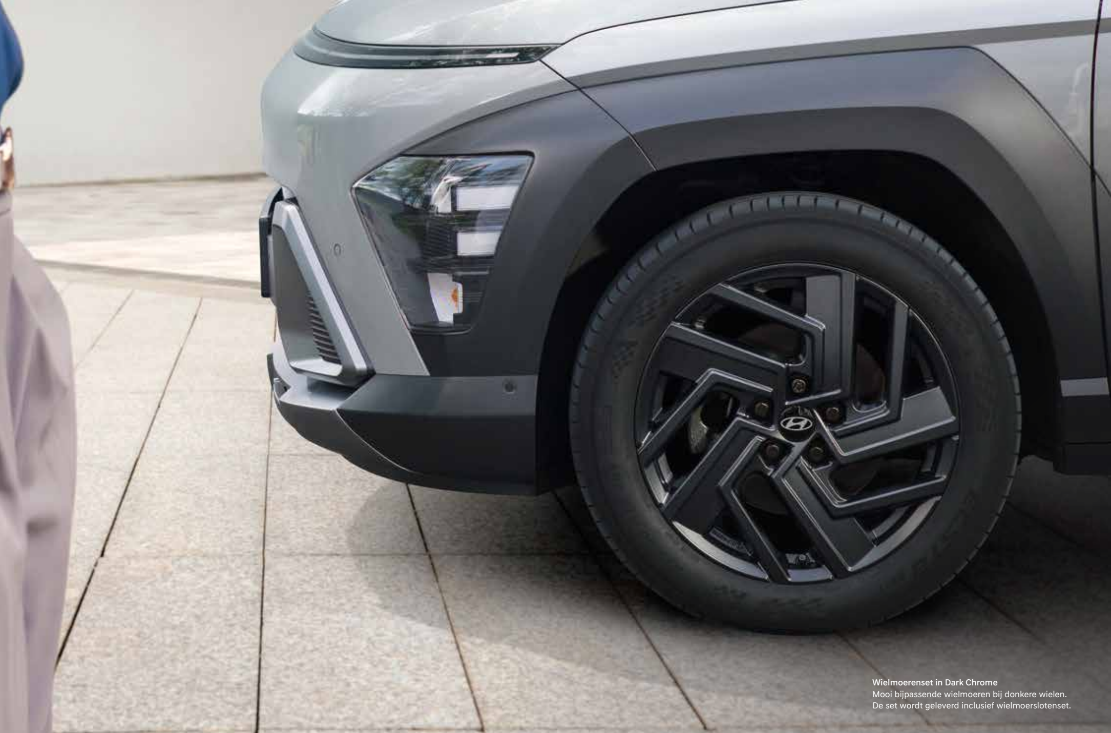
Wielmoerenset in Dark Chrome Mooi bijpassende wielmoeren bij donkere wielen. De set wordt geleverd inclusief wielmoerslotenset.