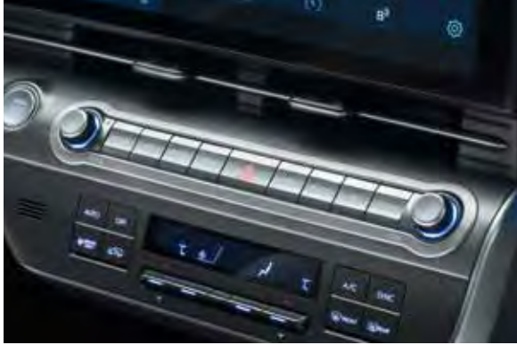
4. Accent op instrumentenpaneel