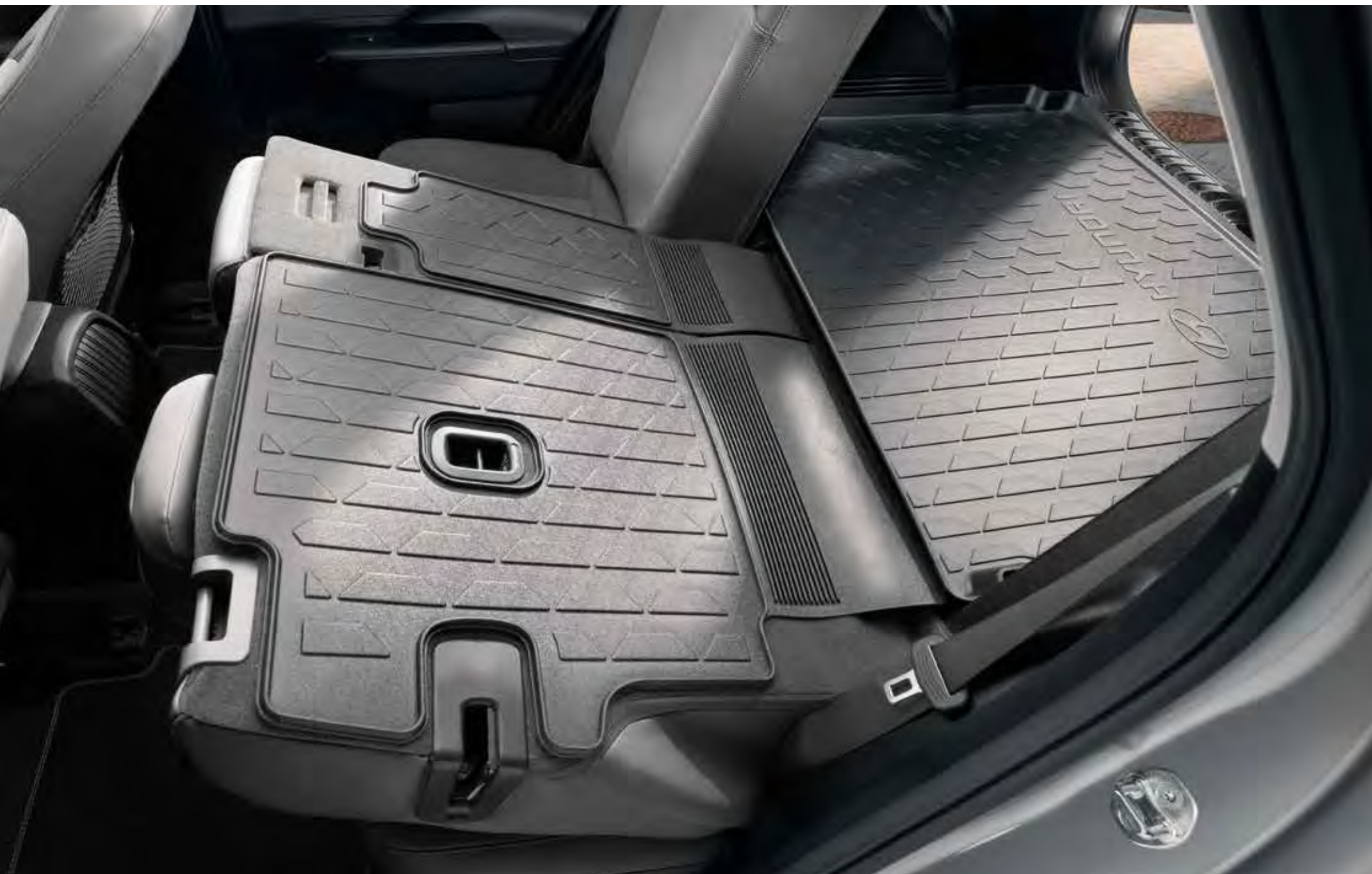
1. Bagagebakbeschermer achterbank