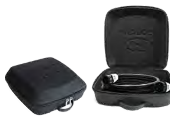
3. Hyundai Cable Case

Heb je wat extra lengte nodig om je Hyundai KONA Electric op te laden? Dat kan met deze laadkabel van 7,5 meter (de versie van 5 meter wordt standaard in een cable case meegeleverd met je KONA Electric). Deze laadkabel is ontworpen en ontwikkeld om foutloos te functioneren onder alle omstandigheden. Hoogwaardige materialen maken de laadkabel goed bestand tegen extreem draaien of buigen en de uitmuntende weerbestendigheid sluit de mogelijkheid van corrosie uit.