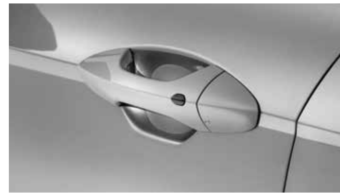
4. Beschermfolie deurehendels