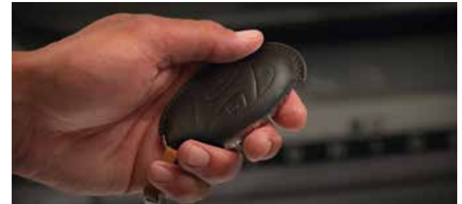
4. Nappa Leather Key Cover