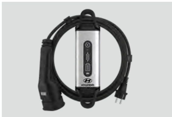
1. Thuislader (220 volt)

Genieten van een duurzaam leven is gemakkelijker wanneer de stroom voor jouw KONA Electric afkomstig is uit schone energie. De optimale manier om jouw KONA op te laden is door gebruik te maken van ons snelle, efficiënte oplaadsysteem. Onze 3-fase-laadkabel is precies wat je nodig hebt om alles uit bestaande laadsystemen te halen. Zodat je met een gerust gevoel alles uit het leven kunt halen.