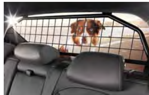
5. Hondenrek (leverbaar medio 2024)