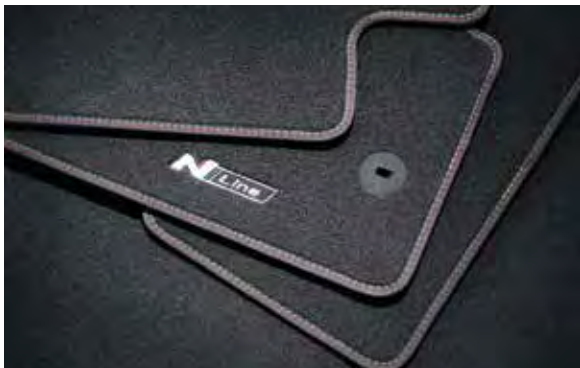
2a. Mattenset velours met N Line-logo