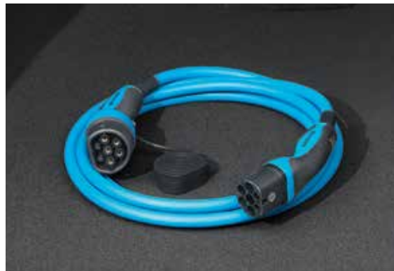
2. Laadkabel in 7,5 meter

Met deze handige lader kun je veilig laden, dit is belangrijk omdat niet iedere elektrische (thuis)installatie gelijk is. De lader is erg robuust en duurzaam en voorzien van een hoge modus. Daarnaast is hij, met de meegeleverde beugel, ook nog eens eenvoudig aan de muur te bevestigen.