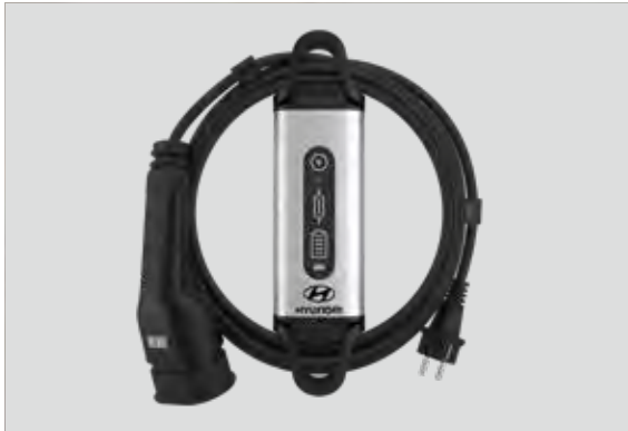
1. Thuislader (220 volt)

Genieten van een duurzaam leven is gemakkelijker wanneer de stroom voor jouw KONA Electric afkomstig is uit schone energie. De optimale manier om jouw KONA op te laden is door gebruik te maken van ons snelle, efficiënte oplaadsysteem. Onze 3-fase-laadkabel is precies wat je nodig hebt om alles uit bestaande laadsystemen te halen. Zodat je met een gerust gevoel alles uit het leven kunt halen.