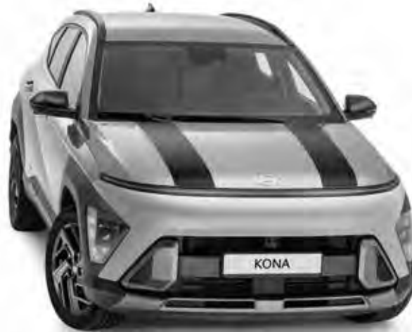
3a. Striping 'Racing stripes', matzwart