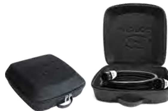
3. Hyundai Cable Case

Heb je wat extra lengte nodig om je Hyundai KONA Electric op te laden? Dat kan met deze laadkabel van 7,5 meter (de versie van 5 meter wordt standaard in een cable case meegeleverd met je KONA Electric). Deze laadkabel is ontworpen en ontwikkeld om foutloos te functioneren onder alle omstandigheden. Hoogwaardige materialen maken de laadkabel goed bestand tegen extreem draaien of buigen en de uitmuntende weerbestendigheid sluit de mogelijkheid van corrosie uit.