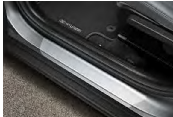
3a. Instapbeschermfolie transparant