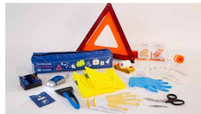
5. Hyundai-calamiteitenpakket 8 in 1