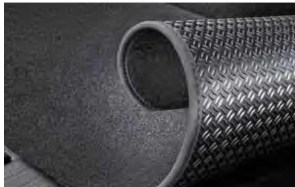
4. Kofferbakmat (omkeerbaar)