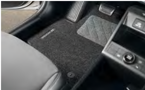
1. Mattenset naaldvilt

Deze kofferbakmat heeft een dubbele functie. Hij is aan de ene kant voorzien van een zacht oppervlak van hoogwaardig velours voor kwetsbare spullen, en aan de andere kant van een stroef en vuilafstotend oppervlak voor de wat ruigere vervoersklussen.