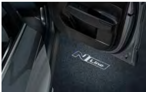
2b. LED-uitstapverlichting met N Line-logo