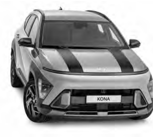
3a. Striping 'Racing stripes', matzwart