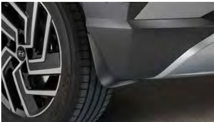
2b. Spatlappenset achter