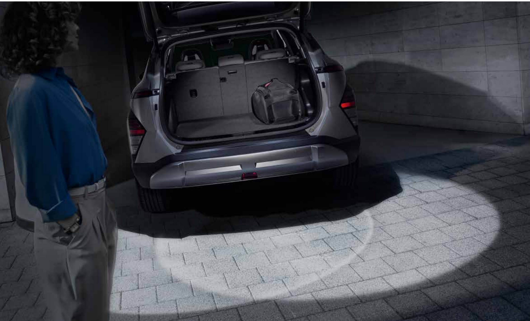
3. LED-verlichting bagageruimte en achterklep